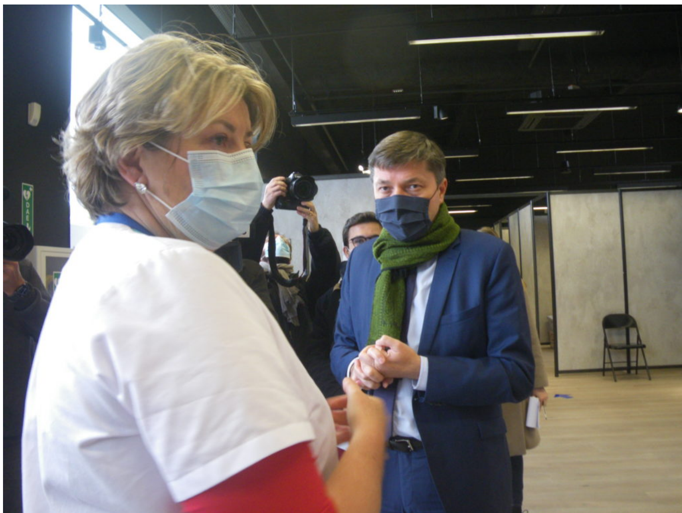
Visite du centre par Bertrand Gaume, préfet de Vaucluse