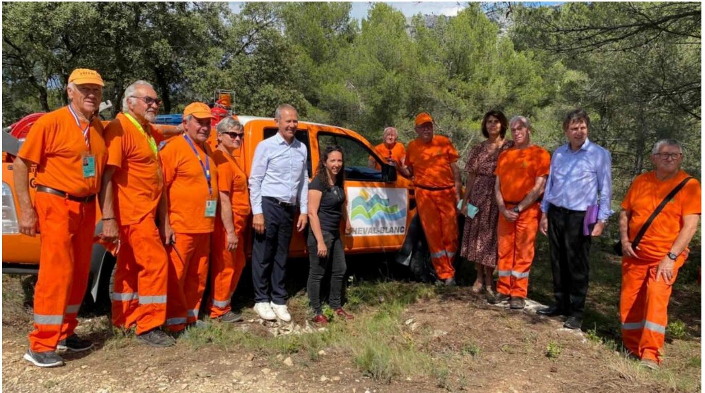
Les élus avec les bénévoles du CCFF de Cheval-Blanc.

incendiaires se retrouvent devant un tribunal ».