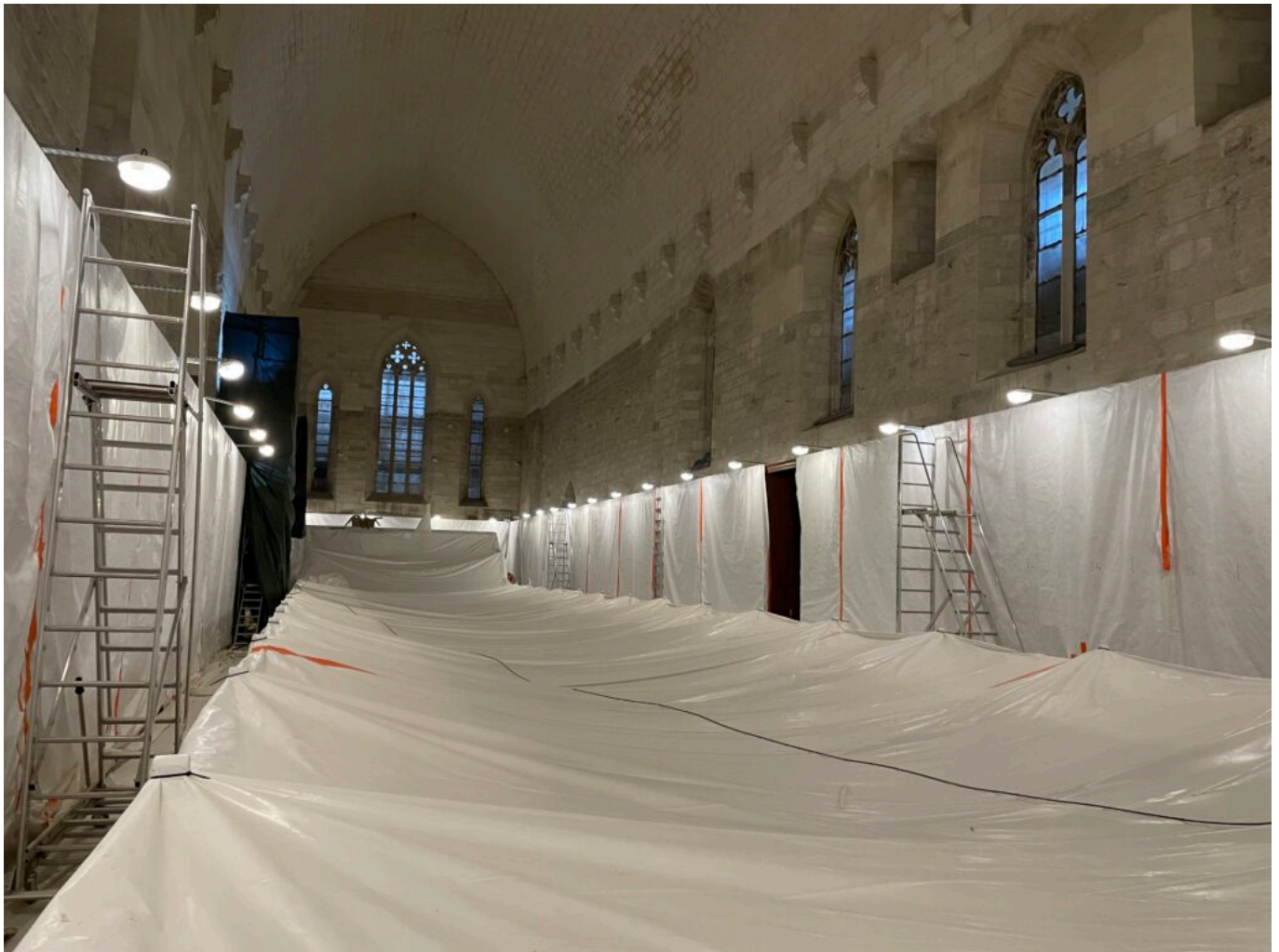
La Chapelle Benoit XII entièrement bâchée