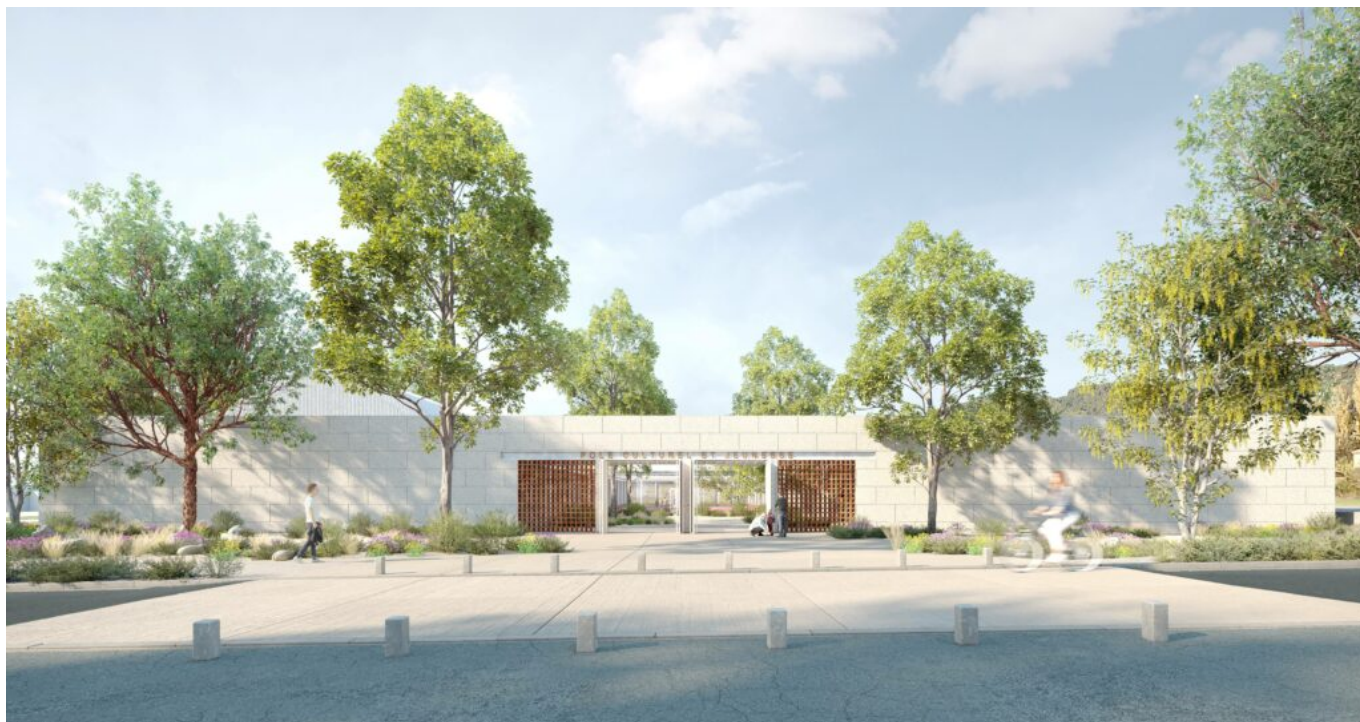
Vue frontale du bâtiment Copyright Tectoniques Architectes

Le bâtiment se déploiera sur 1 200m 2 sur une parcelle de terrain de 6 000m 2 pour un coût de 5,930M€. L'architecte lyonnais, en charge de la réalisation du projet est Tectoniques Architectes. Le bâtiment abritera l'Ecole de musique et de danse, le Club des jeunes et le service Vaison Ventoux Sports.