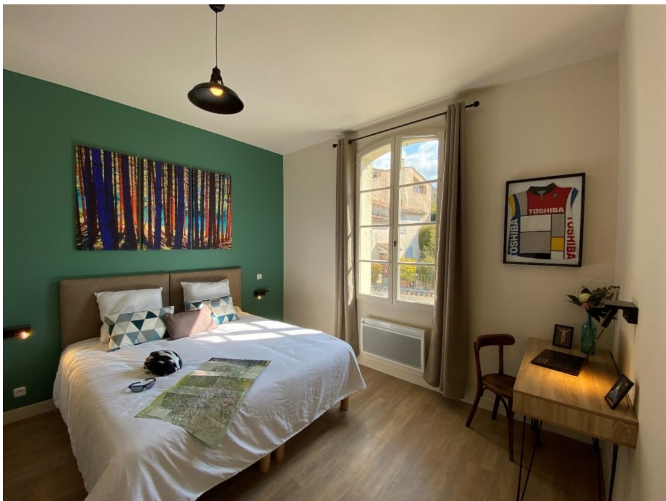
Maillot et carte attendent patiemment.