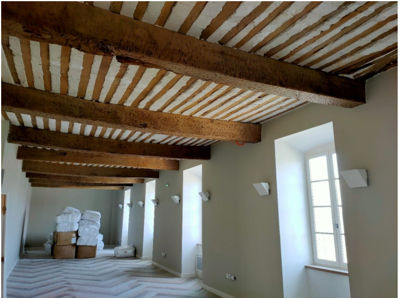
De grands espaces de vie.

Le Nesk propose également un espace bien-être présentant des fondations du 14 e siècle. Pour s'imprégner de l'énergie des lieux, il faut connaître son histoire. A l'origine, les voûtes du bâtiment abritaient une buanderie ou les sœurs religieuses de l'ancien hôpital local lavaient leur linge. « Afin d'exploiter ce lieu au plafond bas, nous avons décidé d'en faire un espace bien-être incluant un sauna, un hammam et une salle de massage. Les gens ont réellement l'impression de descendre dans une crypte lorsqu'ils s'y aventurent. » L'endroit, orné de jolies pierres, dégage une énergie positive, presque spirituelle. Les coureurs pourront ainsi s'octroyer un moment de détente après le sport, les accompagnateurs pourront également profiter de ce moment d'évasion.