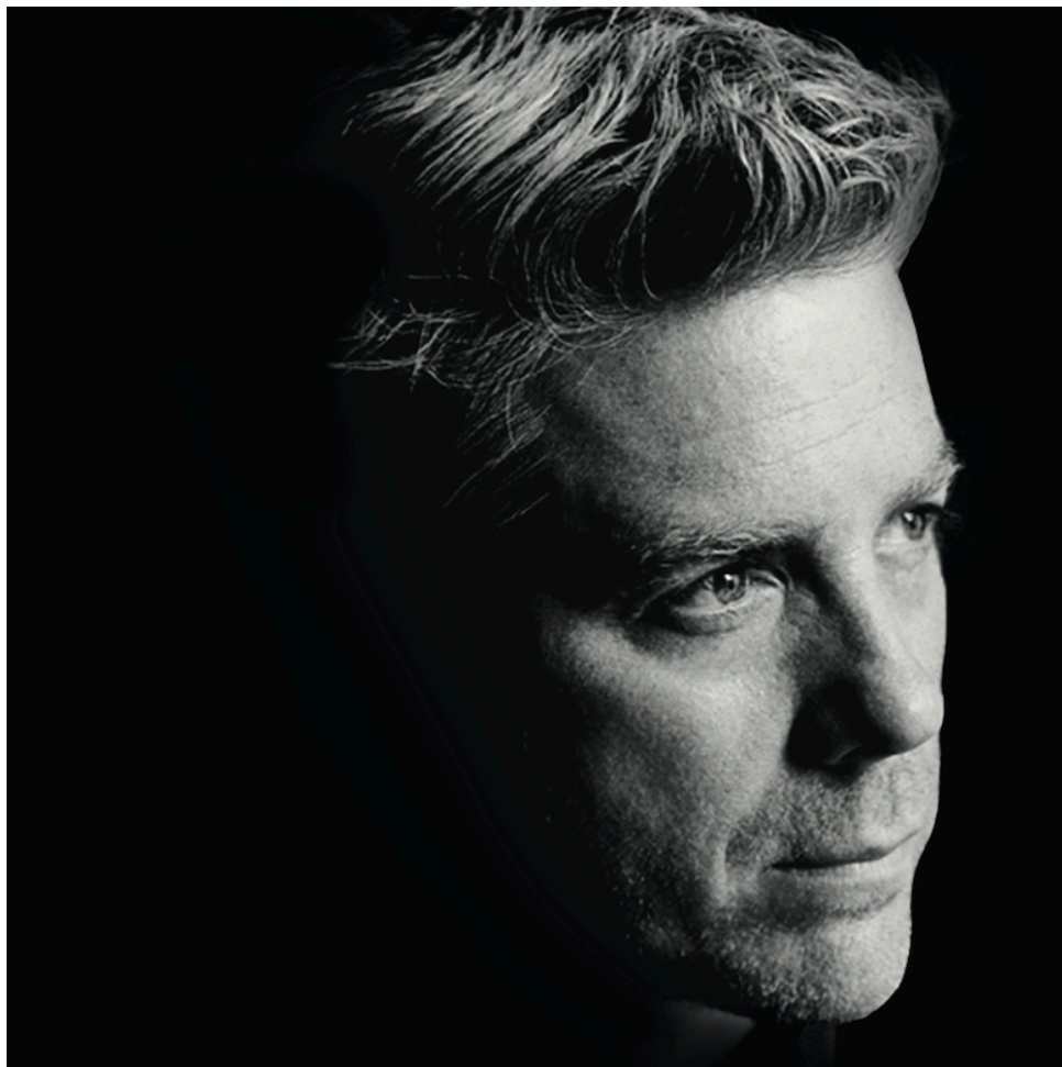
Kyle Eastwood.