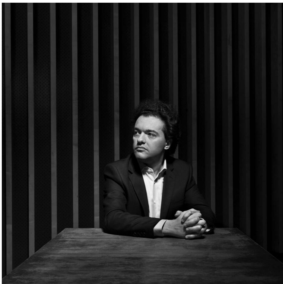
Le pianiste russe Evgeny Kissin.

Comme les Chorégies sont éclectiques et souhaitent chaque année élargir leur audience, elles proposent aussi de la danse le 16 juillet avec le Ballet de la Scale de Milan dont le programme n'est pas encore défini. Du jazz, le 18 avec Eastwood fils, Kyle qui rendra hommage à son papa en interprétant avec son quintet des versions revisitées des bandes originales de films avec saxophone, trompette, contrebasse, guitare basse et batterie.