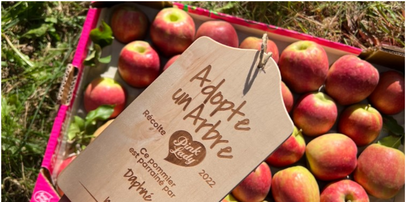
L'Opération adopte un arbre

Pink Lady Europe a supprimé le plastique au profit d'emballages en carton et de barquettes et travaille sur des stickers et étiquettes compostables.