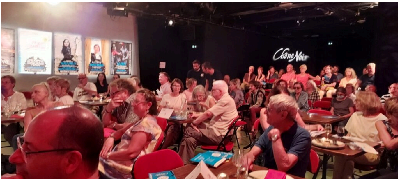
Le public lors de la présentation.