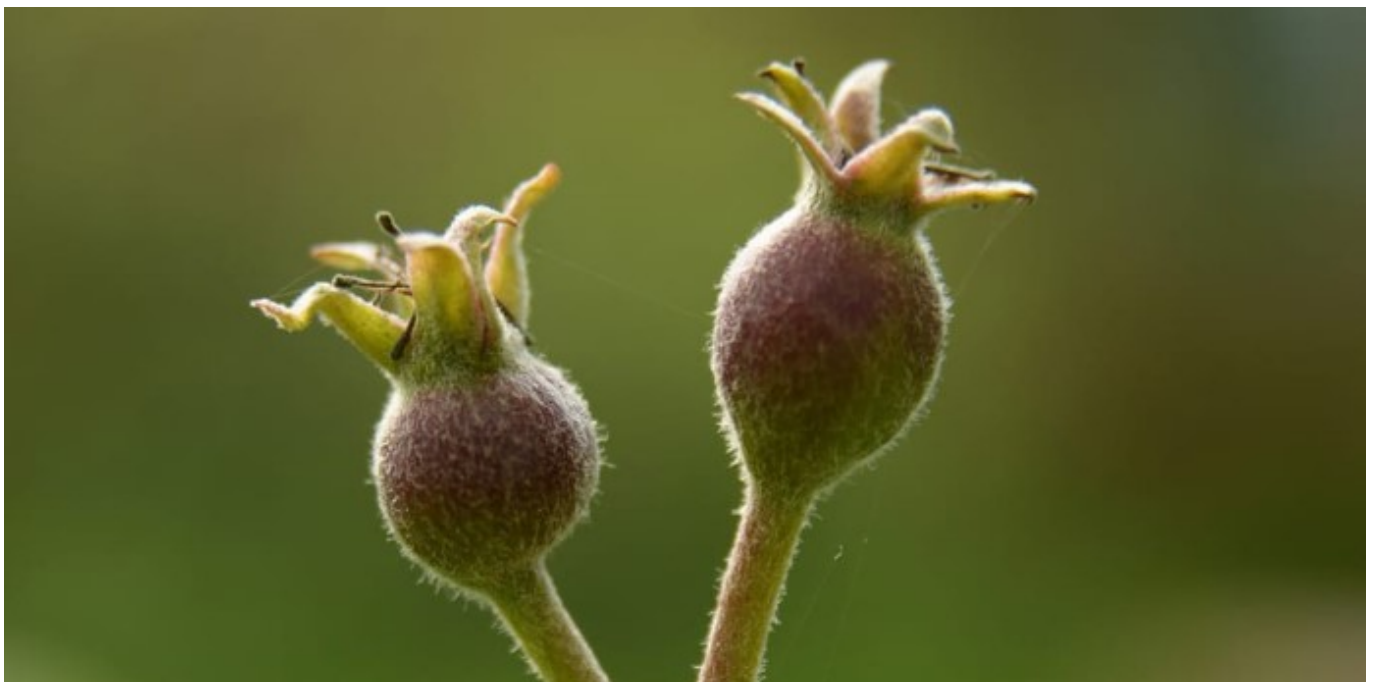
Bourgeons de pommiers

La marque est très sensibilisée aux bonnes pratiques de culture, notamment parce que dans le passé la variété Pink Lady doit lutter contre la tavelure (affection fongique)- et le puceron cendré du pommier.