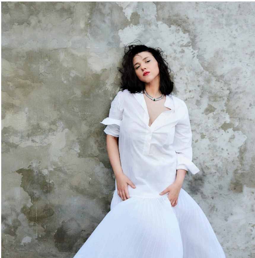
Khatia Buniatishvili.

Mais 2023 sera à coup sûr sublime ! Avec dès l'ouverture, le 2 juillet, une icône, une véritable rock-star du piano, Khatia Buniatishvili qui a donné son 1er concert à l'âge de 6 ans. Elle a remporté le Grand Prix Horowitz à Kiev en 2033 puis le Prix du Public au Concours Arthur Rubinstein en 2008. Depuis, elle parcourt la planète pour une carrière internationale et elle viendra pour la 1ère fois aux Chorégies interpréter l'émouvant Concerto pour piano n° 23 de Mozart.