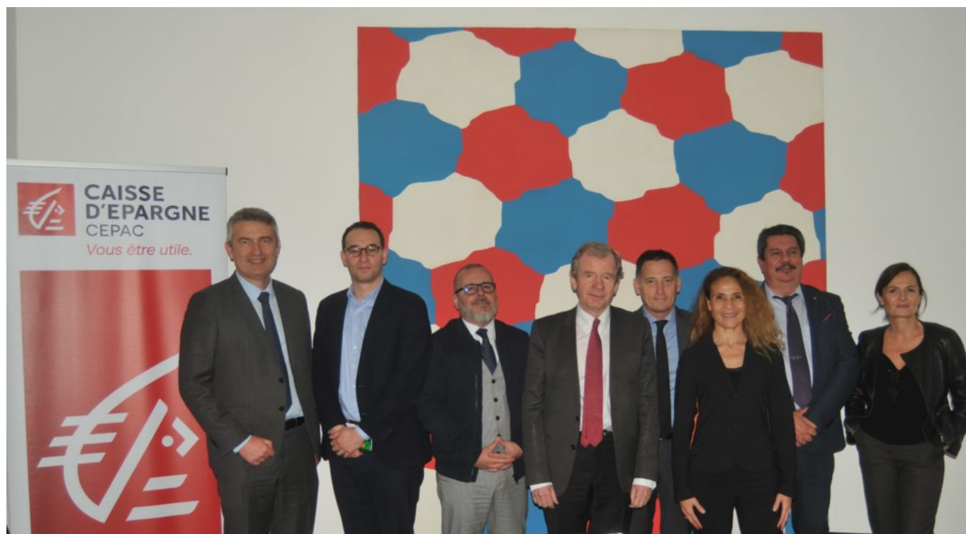
Les représentants de la Cepac et ceux de la Collection Lambert.

Le montant de cette opération de mécénat s'élève à 20 000€ pour une durée de 1 an renouvelable. Il s'ajoute à la dizaine de projets soutenus, chaque année dans le département, par la SLE de la caisse de Vaucluse avec des montants compris entre 3 000 et 15 000€.