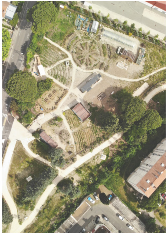
Le site de la ferme urbaine Le Tipi en juin 2021