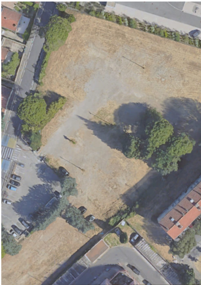
Le site de la ferme urbaine Le Tipi à l'arrivée de l'association en juin 2020

Lire aussi : Paul-Arthur Klein : « le Tipi est la 1ère ferme urbaine du Vaucluse »