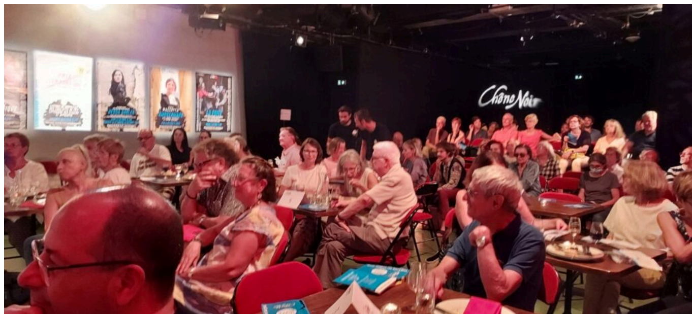
Le public lors de la présentation.