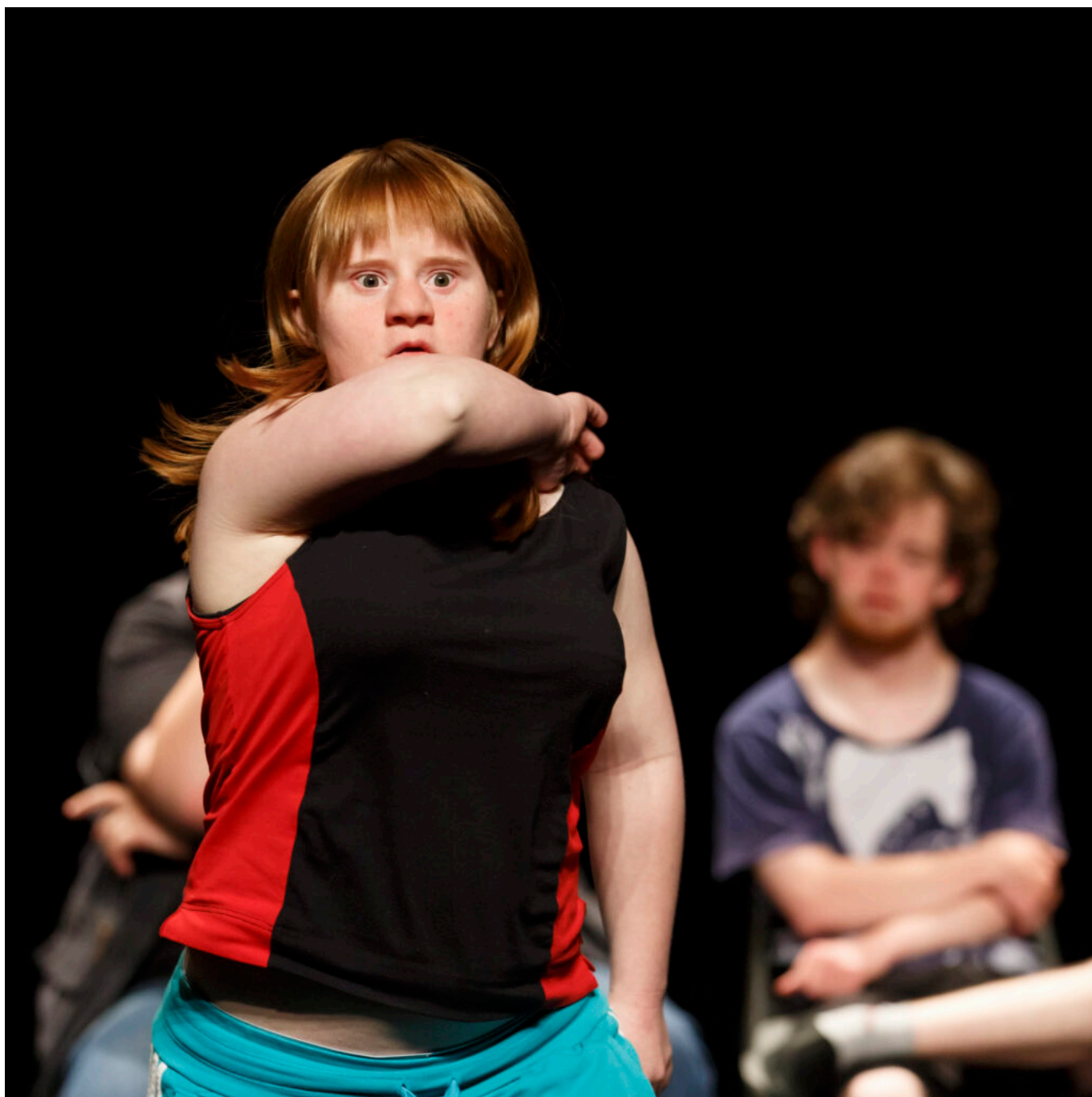
Spectacle Festival d'Avignon 2012 de Jérôme Bel 'Disabled theatre'