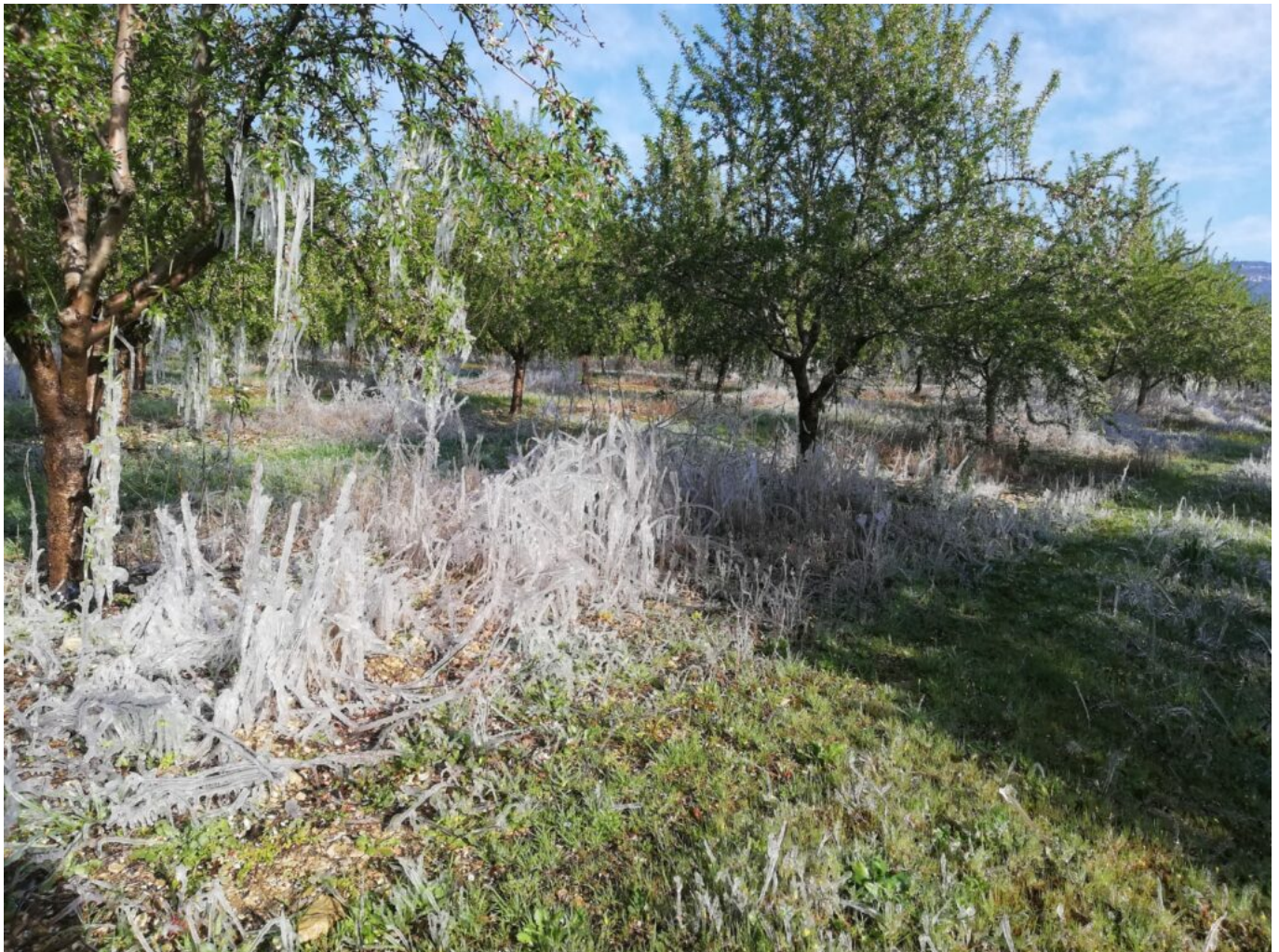
La technique de l'aspersion (solidification de l'eau qui va produire de la chaleur).