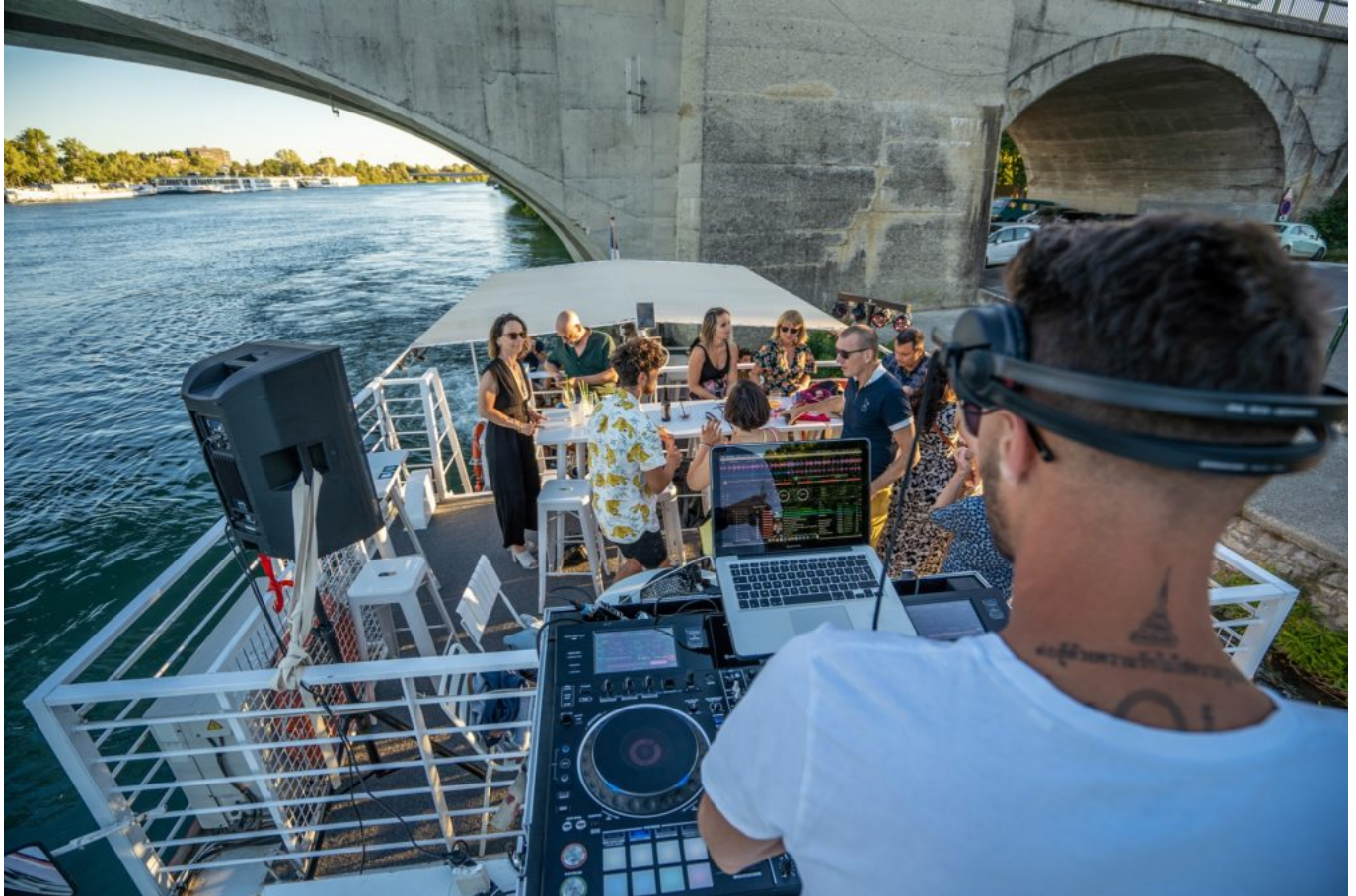
Planche et DJ au programme !