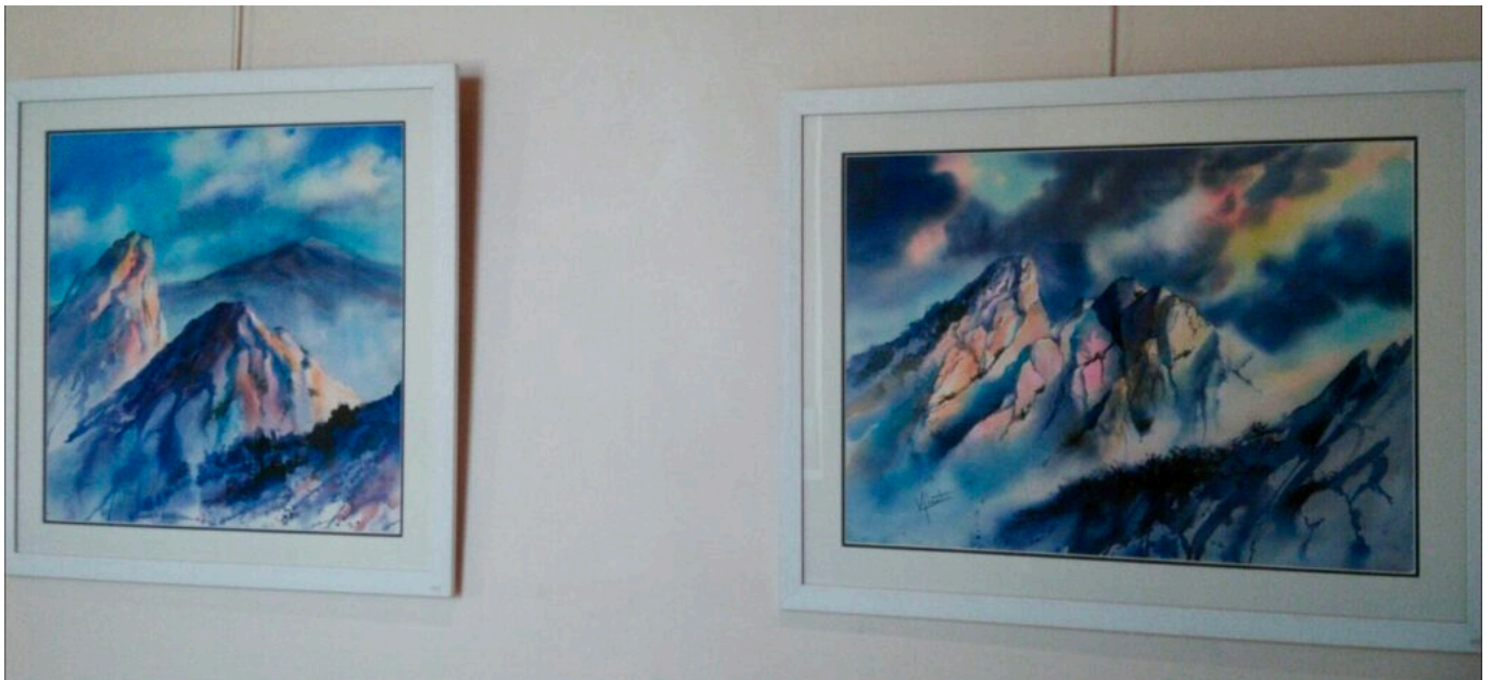
Deux tableaux que vous pouvez admirer à l'exposition. ©Véronique Albert

La mairie de Crillon-le-Brave devra dire au revoir aux peintures de l'artiste avignonnaise Véronique Albert demain. Accessible gratuitement de 10h à 12h30 et de 16h à 19h, cette exposition révèle de nombreux paysages peints à l'aquarelle, une technique de peinture à l'eau. Lorsqu'on entre dans la salle de la mairie, on respire la nature comme si on était au milieu des montagnes grâce aux œuvres affichées aux murs.