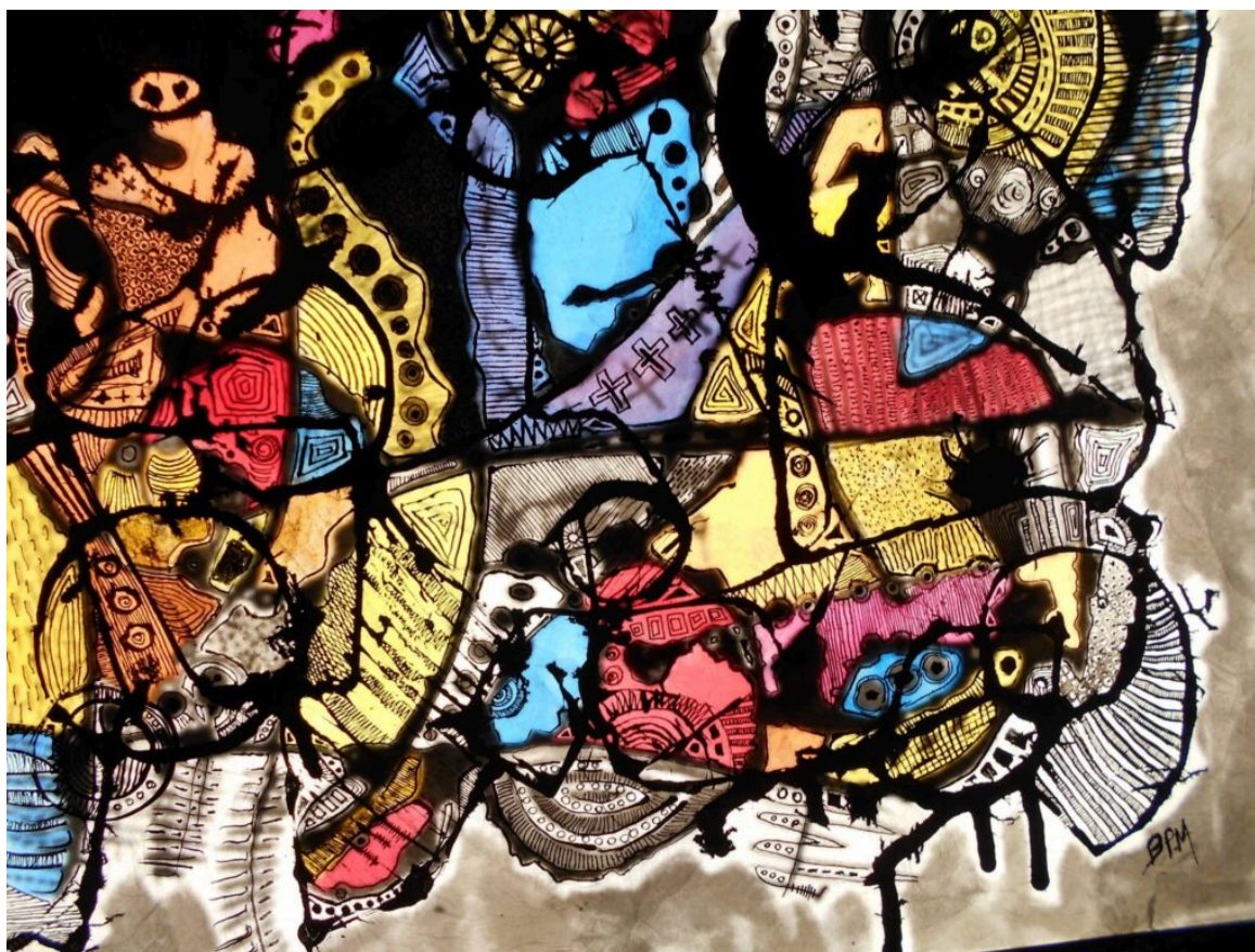
L'une des œuvres exposés à Venasque.