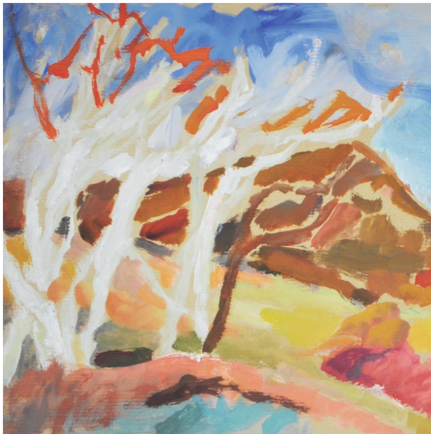
Une des peintures exposés à Crillon-le-Brave. ©Laura Ghirardelli