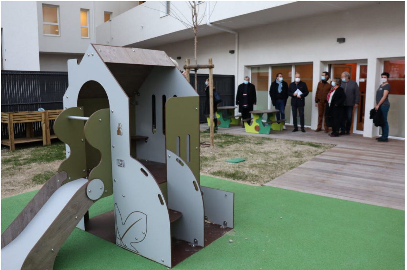
Inauguration de la crèche Au fil du temps.