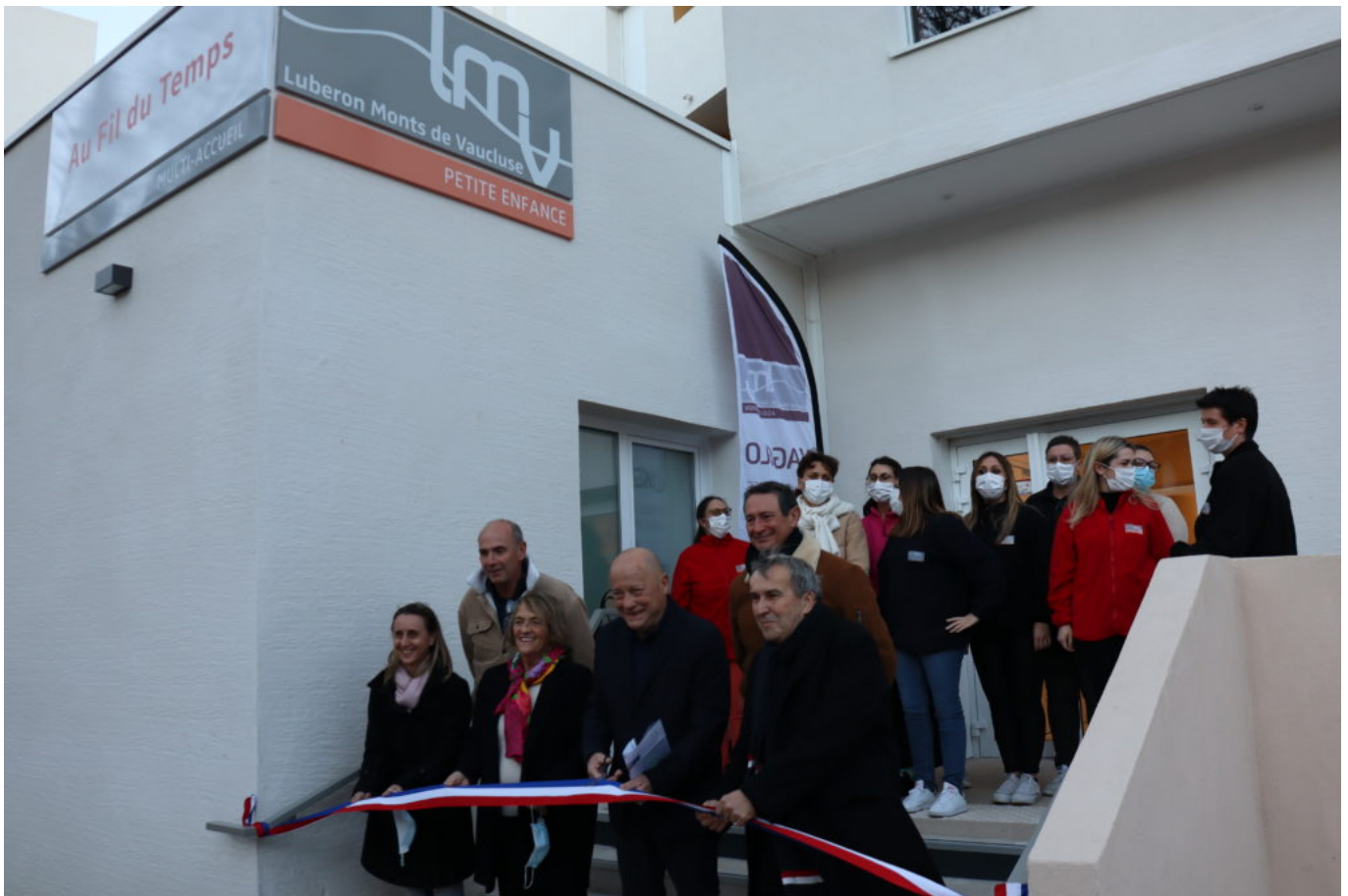
Inauguration de la crèche Au fil du temps.