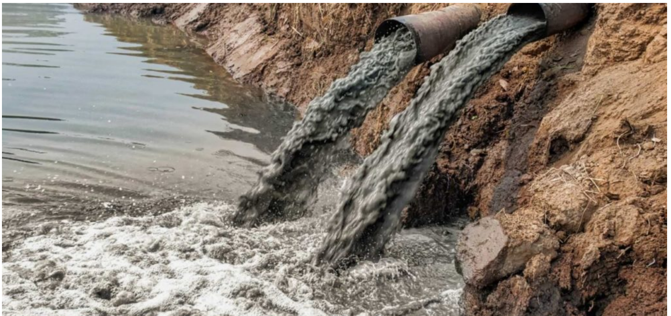
Scénario catastrophe du largage dans la nature...