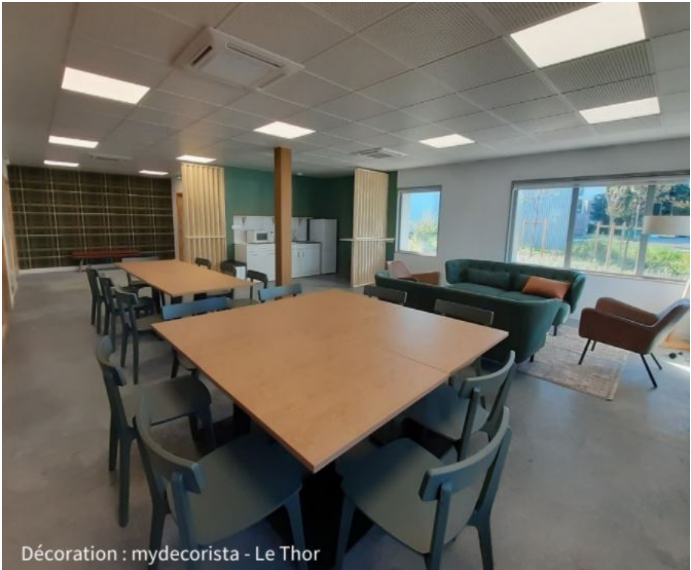
Espaces partagés du Victoria

techniques divisibles en modules de 98m 2 de surface de plancher (en moyenne). Les fonctions techniques pourront être positionnées en RDC (rez-de-chaussée) et une mezzanine pour les espaces de bureau. Le format type d'une plateforme technique sera 50m 2 au sol et 48m 2 en mezzanine. La hauteur en RDC sera plus élevée que les espaces de bureaux en mezzanine. Une plateforme technique pourra néanmoins être totalement dédiée à des bureaux.