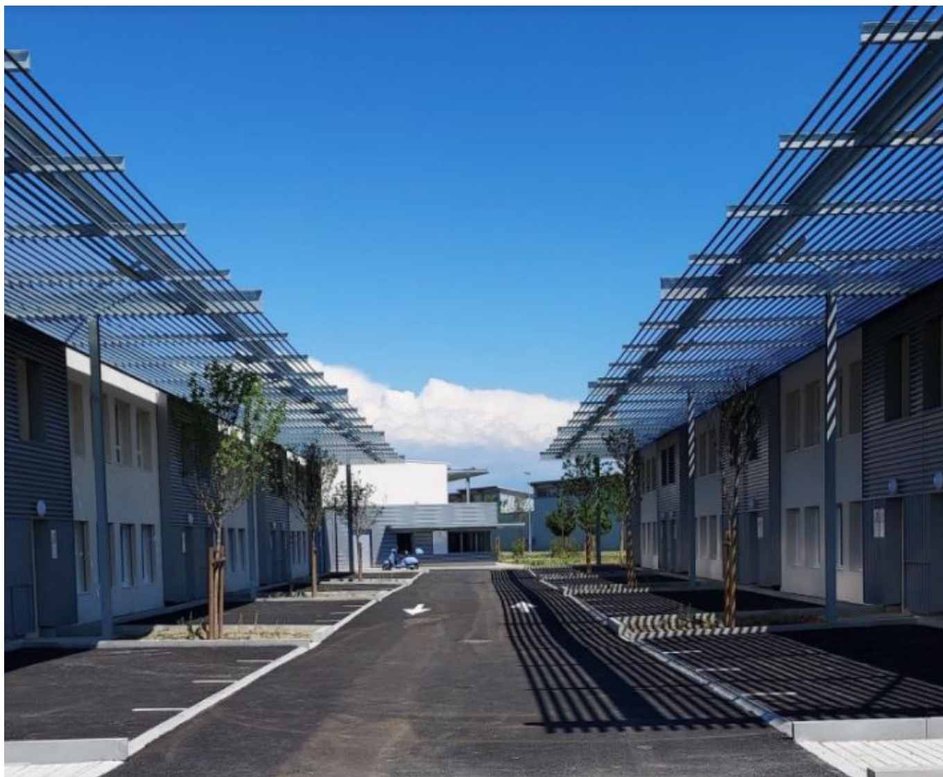
Le Victoria.

plateformes. « Pour la première fois sur le territoire, de jeunes entreprises peuvent se porter acquéreurs de leurs bureaux ou décider de rester locataires à des prix compétitifs, tout en ayant à disposition des espaces partagés : un afterwork, une réunion, un café ou une douche après le sport ou un trajet à vélo. Le Victoria a été pensé pour cela et pour que les talents puissent se connecter », précise le Grand Avignon.