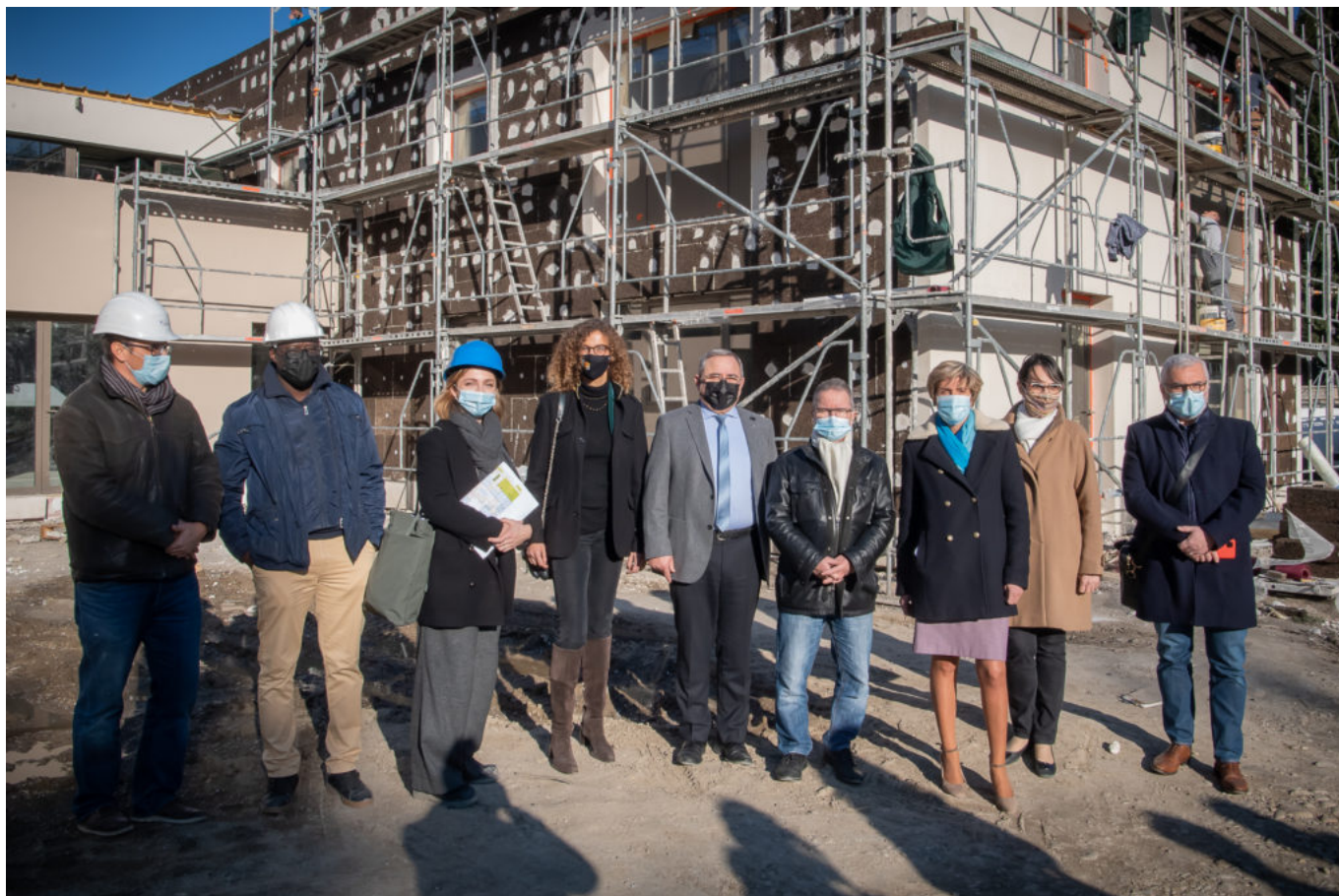
Visite de chantier.

implique de nombreux partenaires et financeurs. Les subventions au titre du CRET (Contrats régionaux d'équilibre territorial) allouées par la Région Sud sont de 900 000€ sur les bâtiments et 160 000€ sur l'aménagement du site.