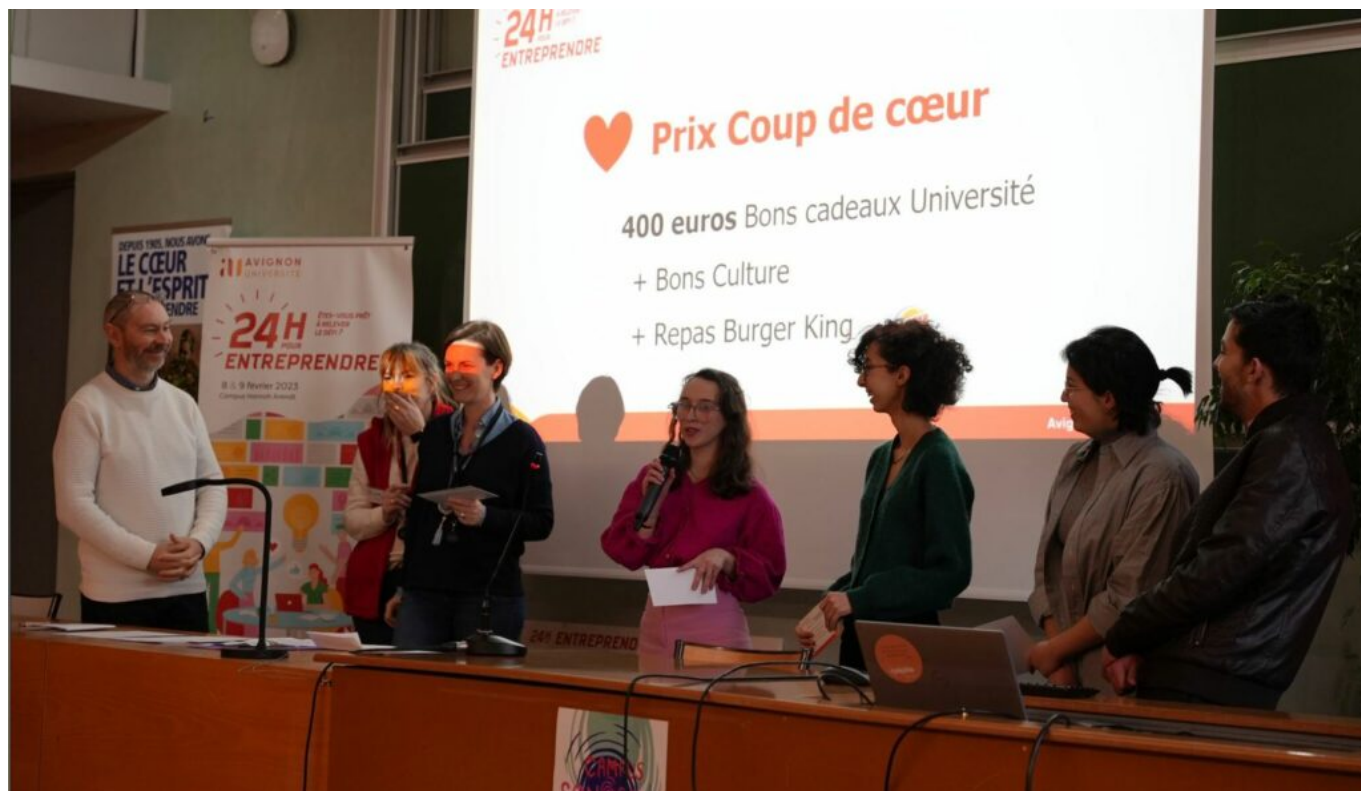
Les étudiants ayant remporté le prix coup de cœur