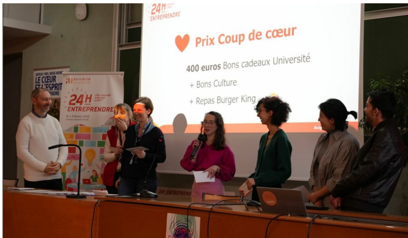
Les étudiants ayant remporté le prix coup de cœur