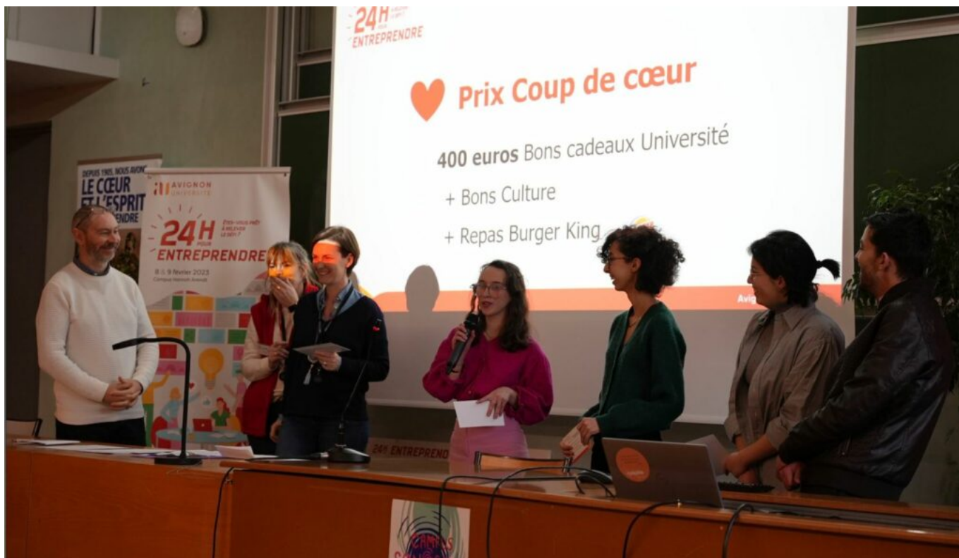
Les étudiants ayant remporté le prix coup de cœur