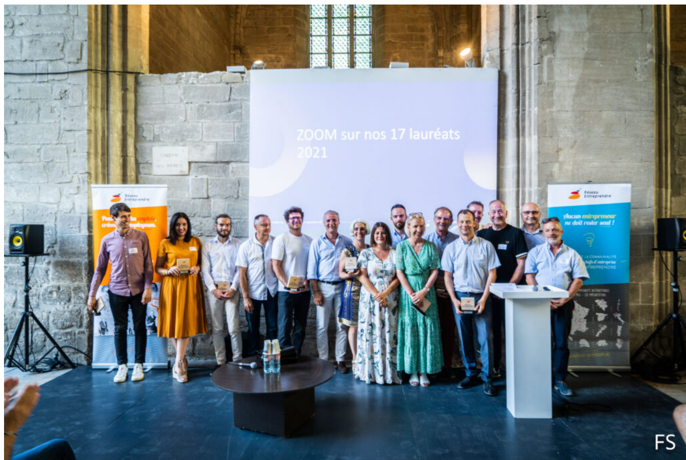
Les lauréats 2021 et les accompagnateurs du Réseau entreprendre Rhône-Durance.

Intégrée au réseau national créé en 1986 dans le Nord de la France, la section vauclusienne qui a vu le jour en 2003 avant de se transformer en associations départementales en 2013, couvre aujourd'hui l'ensemble du Vaucluse mais aussi le Nord des Bouches-du-Rhône ainsi qu'une partie du Gard rhodanien. Dans ce cadre, après avoir accompagné 10 lauréats en 2020, pour un total de prêts d'honneur de 430 000€, Réseau entreprendre Rhône-Durance en a soutenu 17 en 2021. Cela représente 11 entreprises lauréates (ndlr : il peut y avoir plusieurs lauréats pour une entreprise) : 5 créations, 4 reprises et 2 développements pour un montant total de 439 000€ de prêts engagés. De quoi créer et sauvegarder 193 emplois sur le territoire.