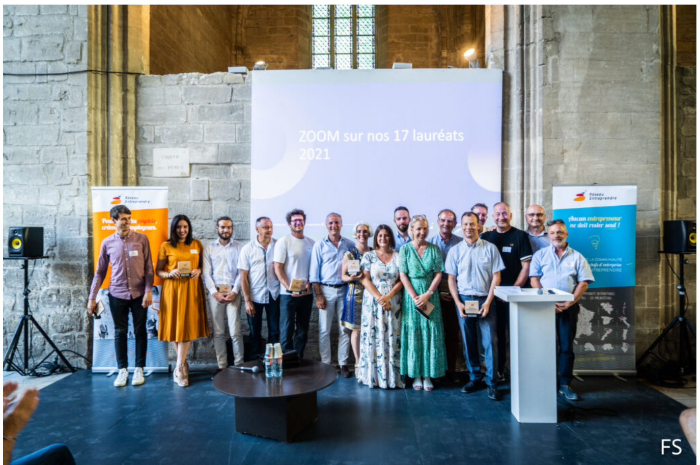
Les lauréats 2021 et les accompagnateurs du Réseau entreprendre Rhône-Durance.

Intégrée au réseau national créé en 1986 dans le Nord de la France, la section vauclusienne qui a vu le jour en 2003 avant de se transformer en associations départementales en 2013, couvre aujourd'hui l'ensemble du Vaucluse mais aussi le Nord des Bouches-du-Rhône ainsi qu'une partie du Gard rhodanien. Dans ce cadre, après avoir accompagné 10 lauréats en 2020, pour un total de prêts d'honneur de 430 000€, Réseau entreprendre Rhône-Durance en a soutenu 17 en 2021. Cela représente 11 entreprises lauréates (ndlr : il peut y avoir plusieurs lauréats pour une entreprise) : 5 créations, 4 reprises et 2 développements pour un montant total de 439 000€ de prêts engagés. De quoi créer et sauvegarder 193 emplois sur le territoire.