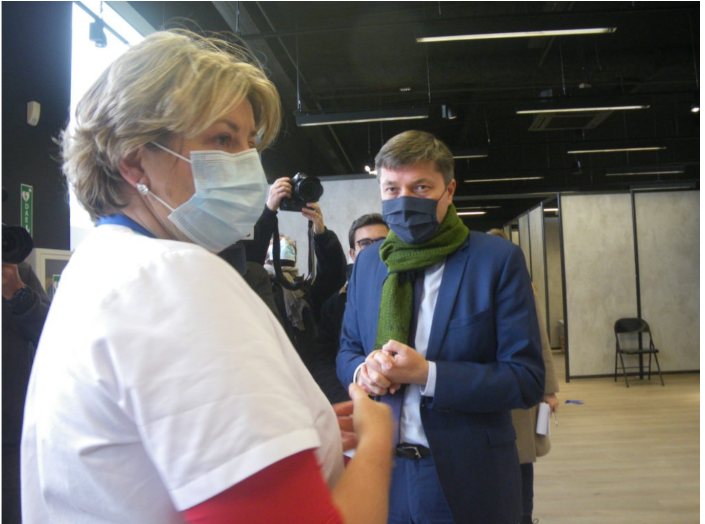
Visite du centre par Bertrand Gaume, préfet de Vaucluse