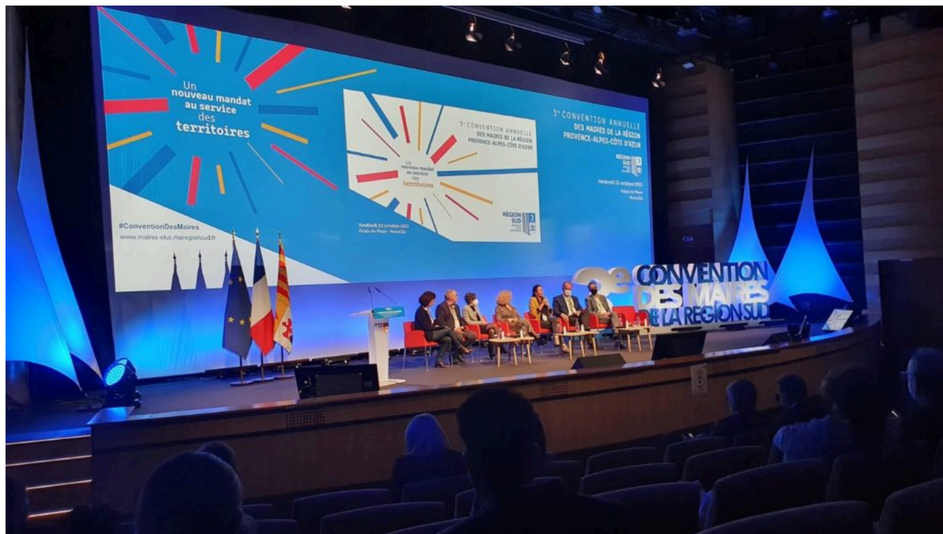
Remise des prix lors de la convention des maires de la Région Sud.

Dans le même sujet : ‘En place’ : deux ingénieurs avignonnais révolutionnent le stationnement en centre-ville