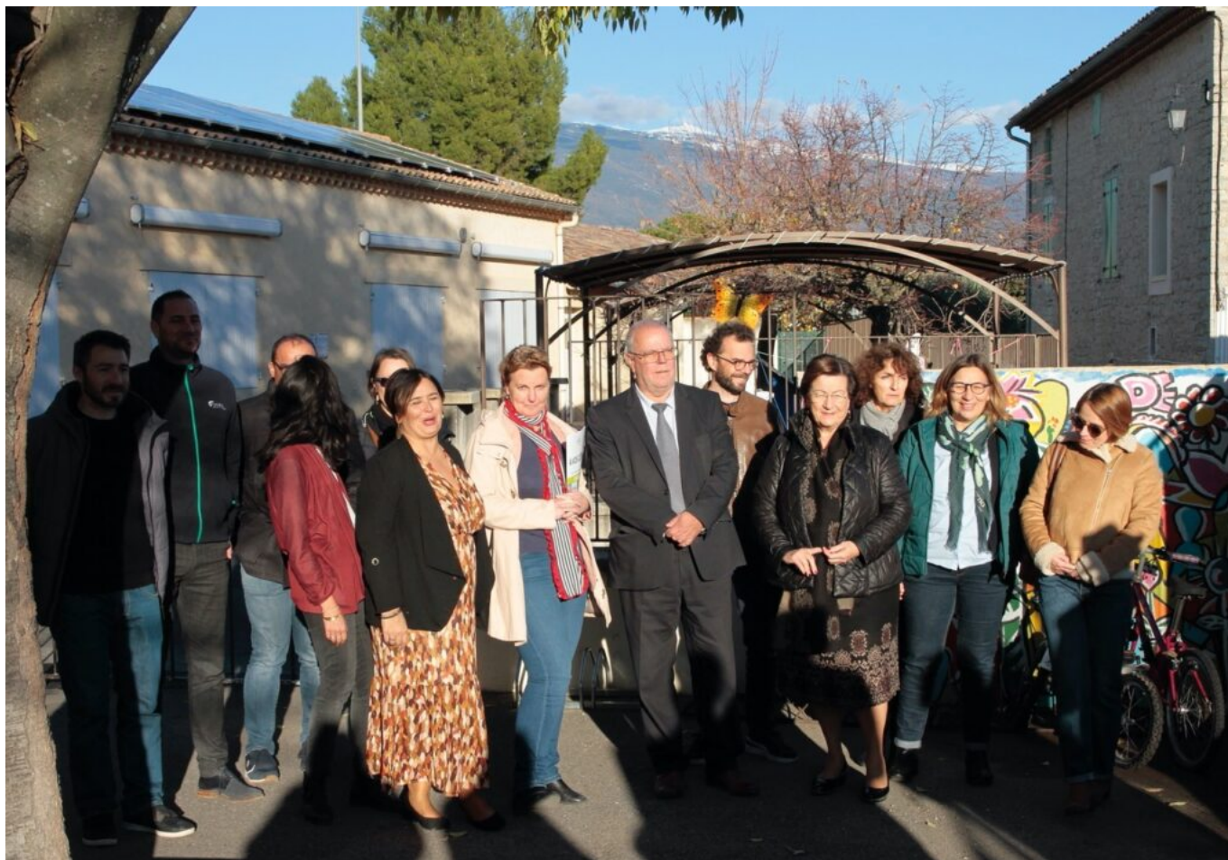
Les représentants de la Cove et les élus du territoire lors de l'inauguration à Saint-Pierre-de-Vassol.

3 projets communaux sont à l'étude dans les villages pour l'installation de centrales photovoltaïques : sur les vestiaires du plateau sportif au Barroux, sur le centre culturel et sportif de Saint-Didier, et sur le parking de la Boiserie à Mazan.