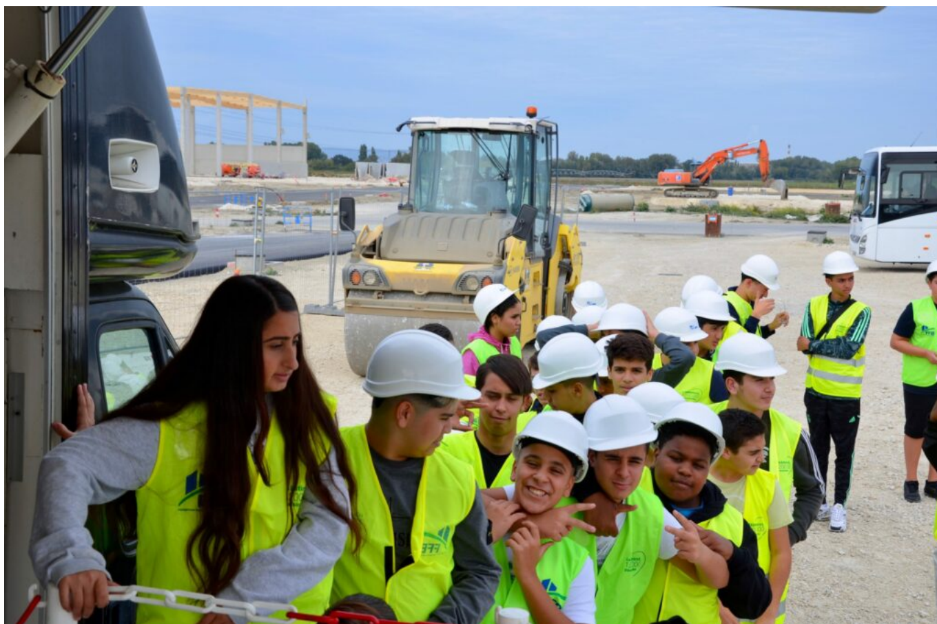
Les Coulisses du BTP à Bollène