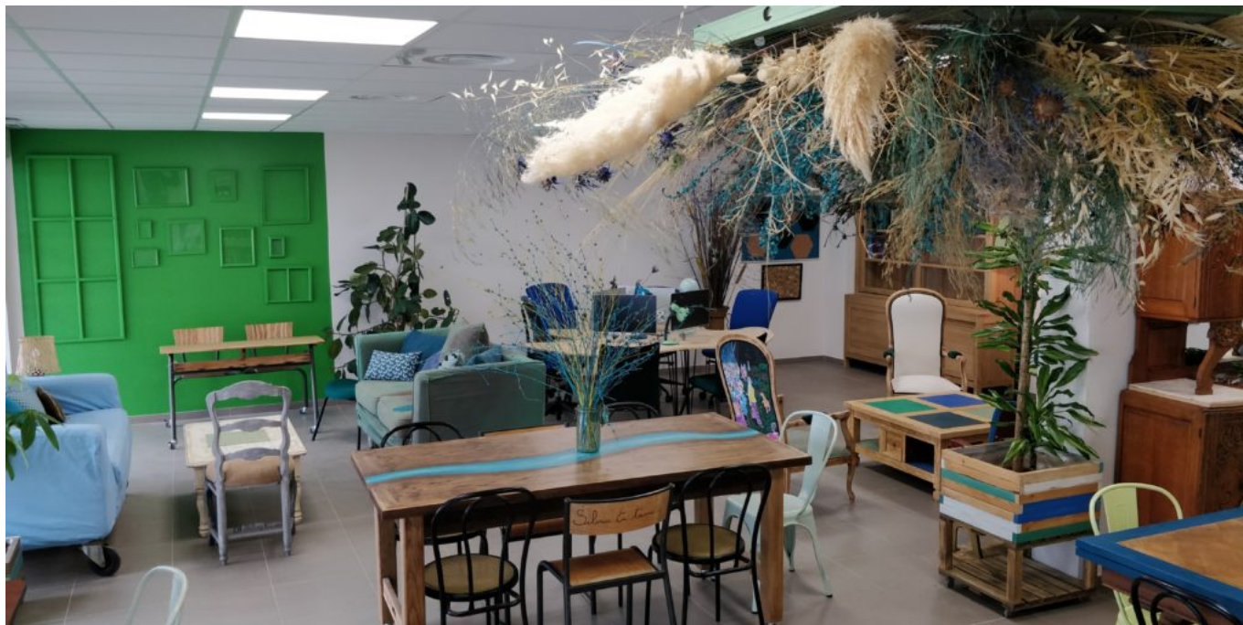
La Maison partagée pour 'faire société' de 7 à 77 ans et plus...