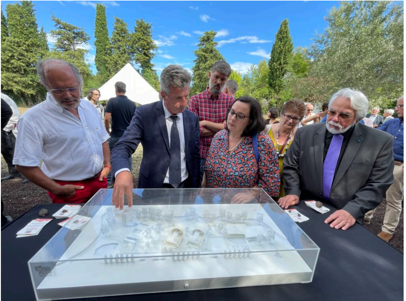
La présentation du projet par les architectes sur le terrain dévolu au projet Seul sur Mars