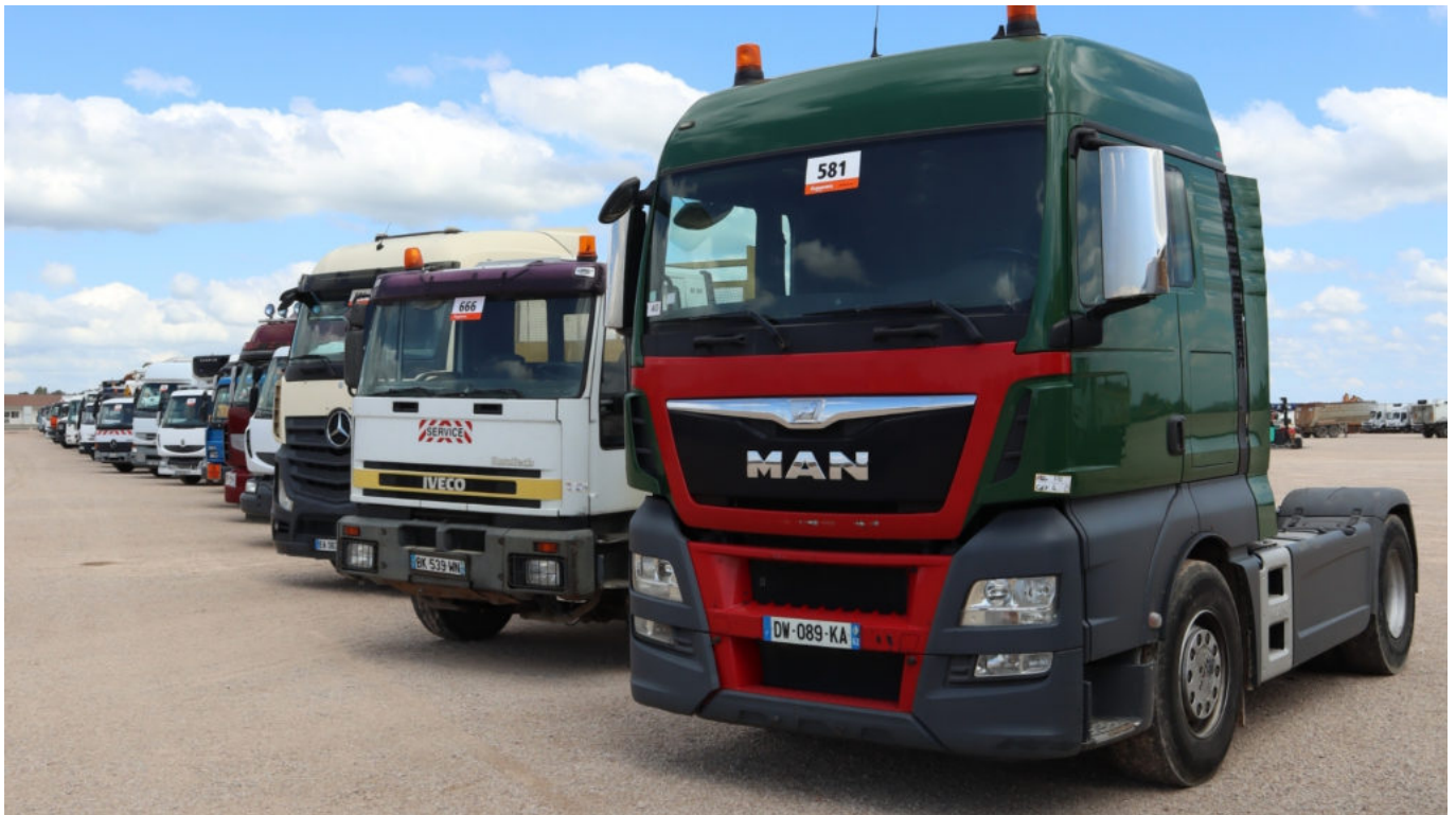
Parc de gestion à Avignon.

En 2021, pour pallier la distance induite par le digital, Ritchie Bros souhaite se rapprocher de ses clients en renforçant sa présence sur le territoire national. grâce à ses 4 sites en France. L'entreprise souhaite ouvrir prochainement de nouveaux sites satellites pour homogénéiser son maillage sur le territoire. « Au-delà du lien régional entre le commercial et ses clients, l'ouverture de nouveaux sites en France permet une diminution des coûts de transport. Chaque vendeur entretient une relation particulière avec son commercial qui lui est rattaché. Le commercial conseille son vendeur en mettant à profit son expertise et sa connaissance du marché pour déterminer la valeur de l'équipement mis en vente ». Afin d'accompagner encore mieux ses clients, Ritchie Bros souhaite renforcer ses équipes commerciales. Aujourd'hui composée de 7 commerciaux, l'équipe recrute de nouveaux collaborateurs au Nord-Est et au secteur agricole.