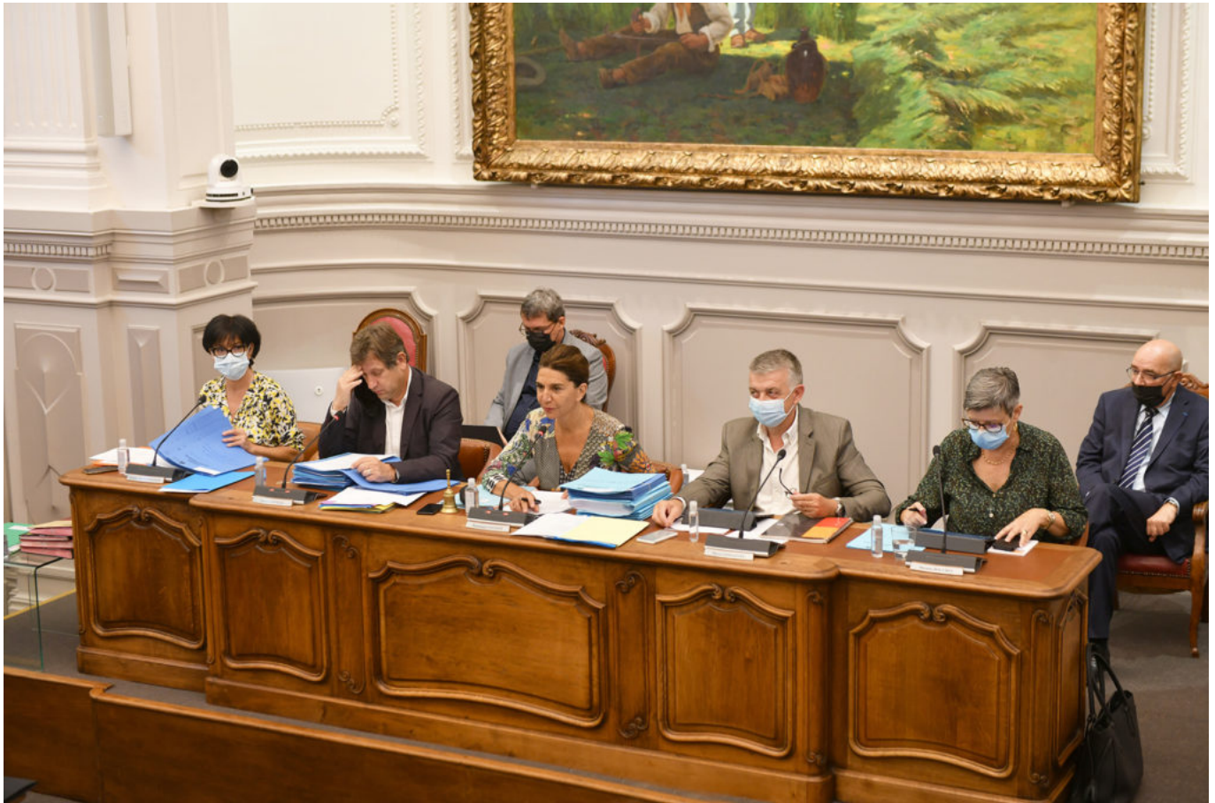
Séance de l'Assemblée départementale de Vaucluse du vendredi 24 septembre 2021.

plus de faire face aux dépenses immédiates, nécessaires à la poursuite de leur activité et aux besoins essentiels du foyer. En Vaucluse, l'aide financière attribuée par l'Etat est d'un montant plafonné à 5 000€ par exploitation.