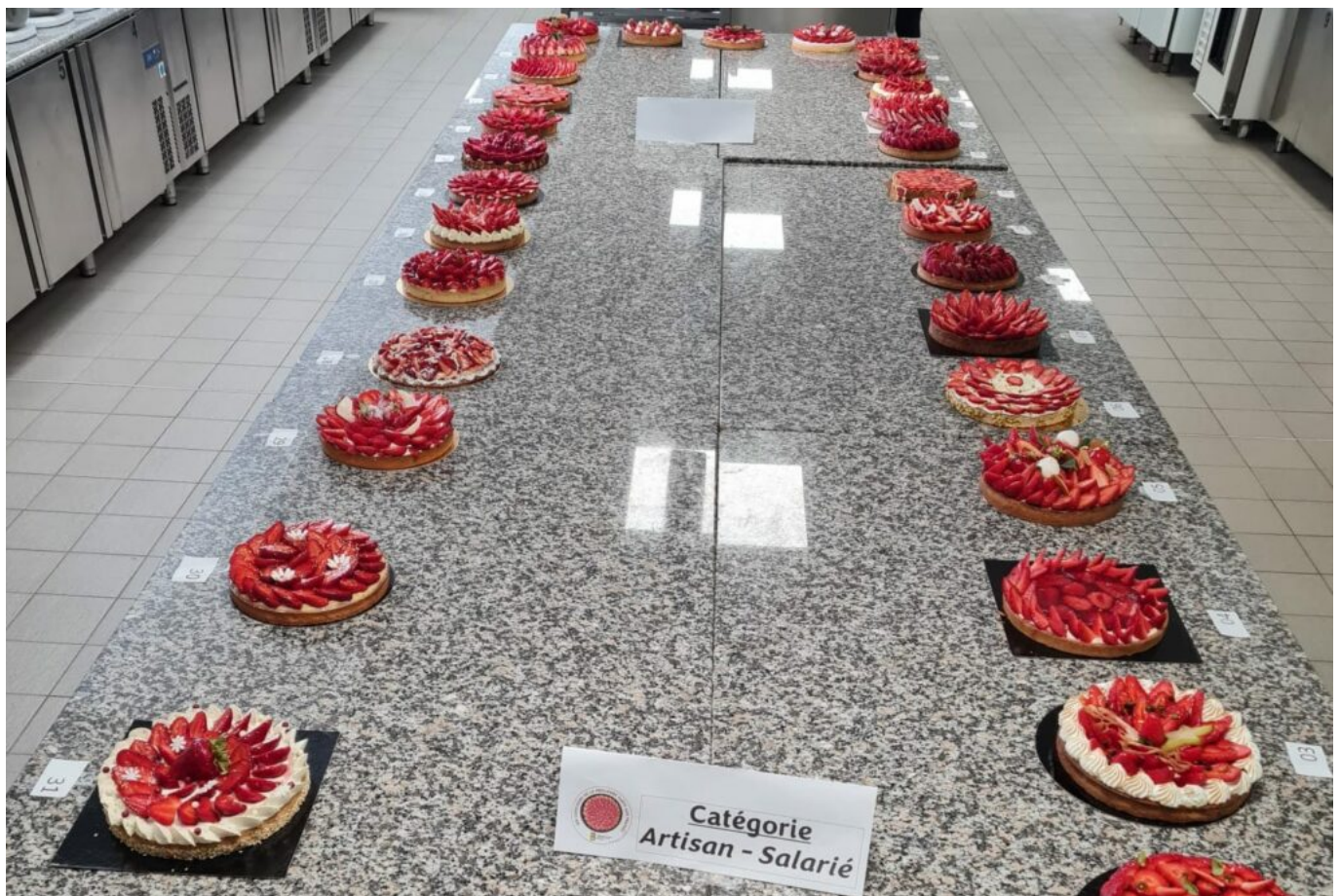
© Groupement des artisans Boulangers Pâtisiers du Vaucluse