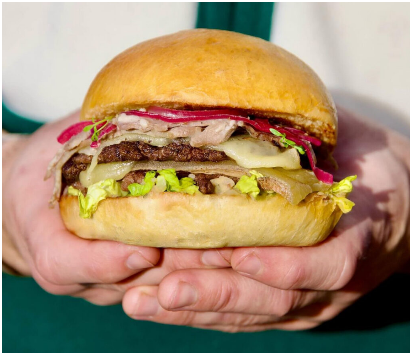
Le Super Smash Beef de Guillaume Redon.