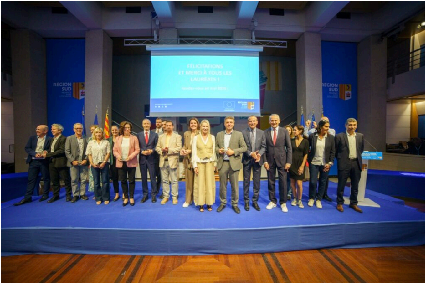
Les lauréats.

Parmi les lauréats cette année, on compte notamment l'exploitation Saint Félix, basée à Cavailon, qui est arrivée en haut du classement pour la catégorie 'Biodiversité'. Son projet, qui a aussi reçu le Prix spécial du jury, se base sur l'acquisition et l'installation de filets mono-rangs anti-insectes sur ses pommiers, afin de protéger les cultures sans avoir recours aux pesticides, tout en préservant la biodiversité. Le projet présente d'autres avantages tels que la réduction des traitements, de la consommation d'eau, des passages de tracteurs et donc leurs émissions de gaz à effet de serre.