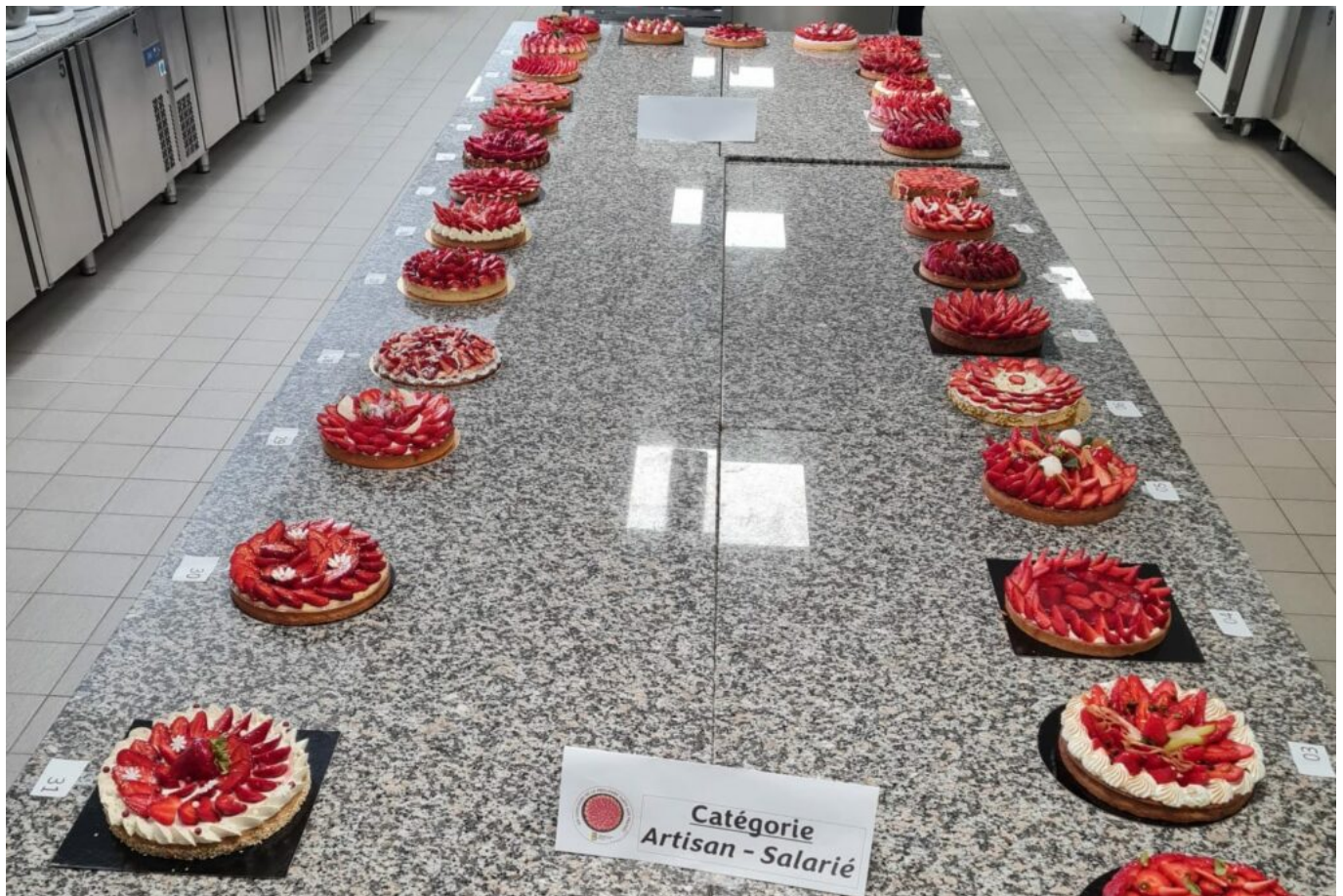
© Groupement des artisans Boulangers Pâtisiers du Vaucluse