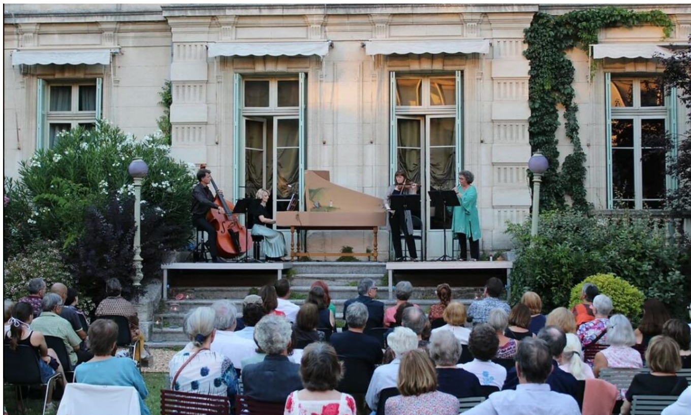
Concerts dans le jardin du Musée Vouland

Jeudi 18 août à 19h. Tarif: participation libre et solidaire prix conseillé 12€. Réservation : 04 90 86 03 793