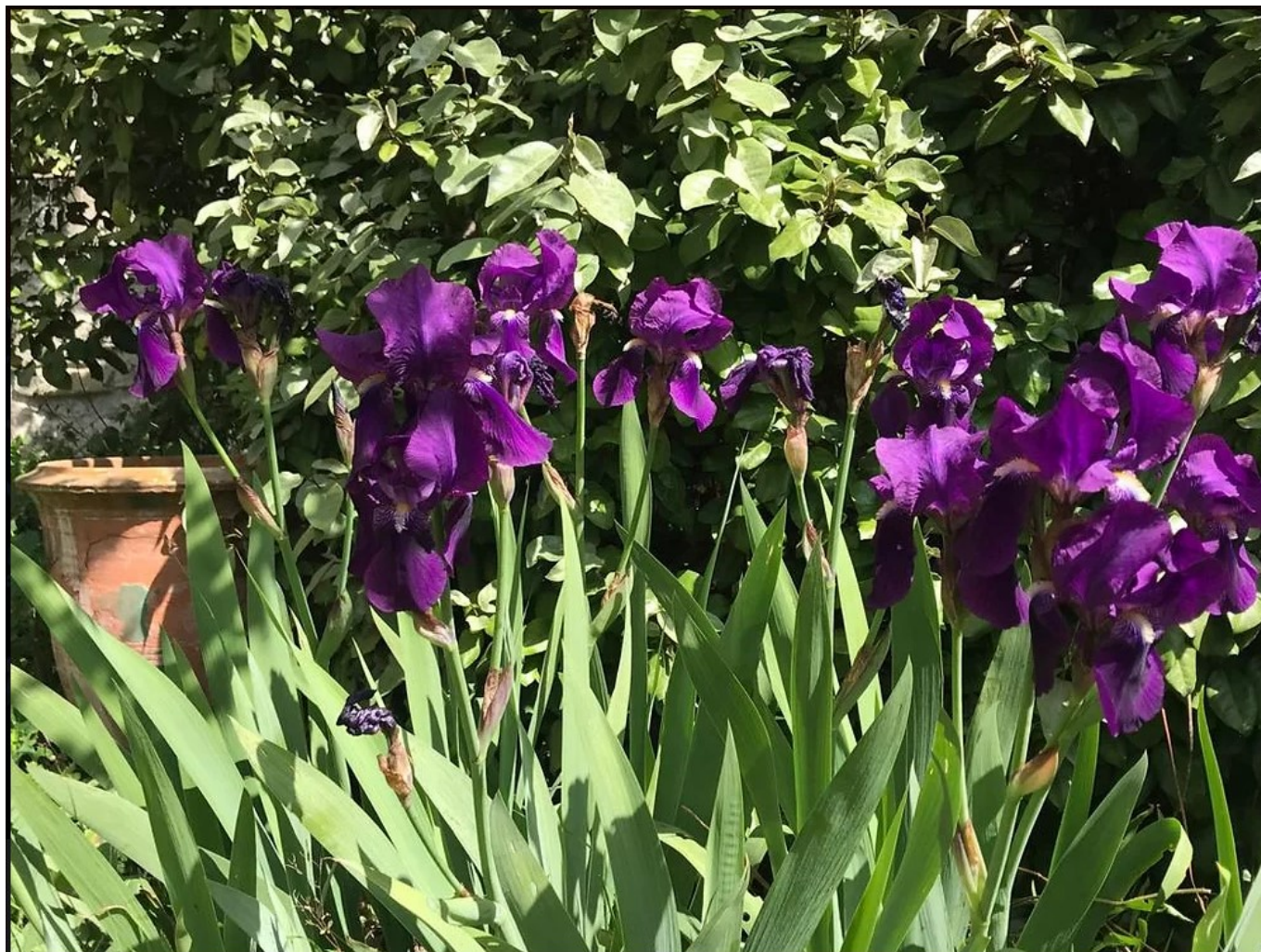
DR Jardin fleuri du Musée Vouland