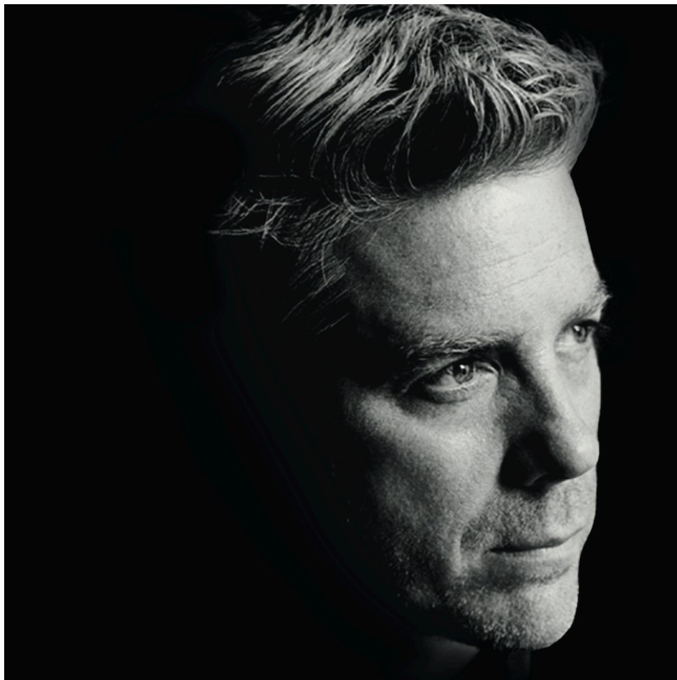
Kyle Eastwood.