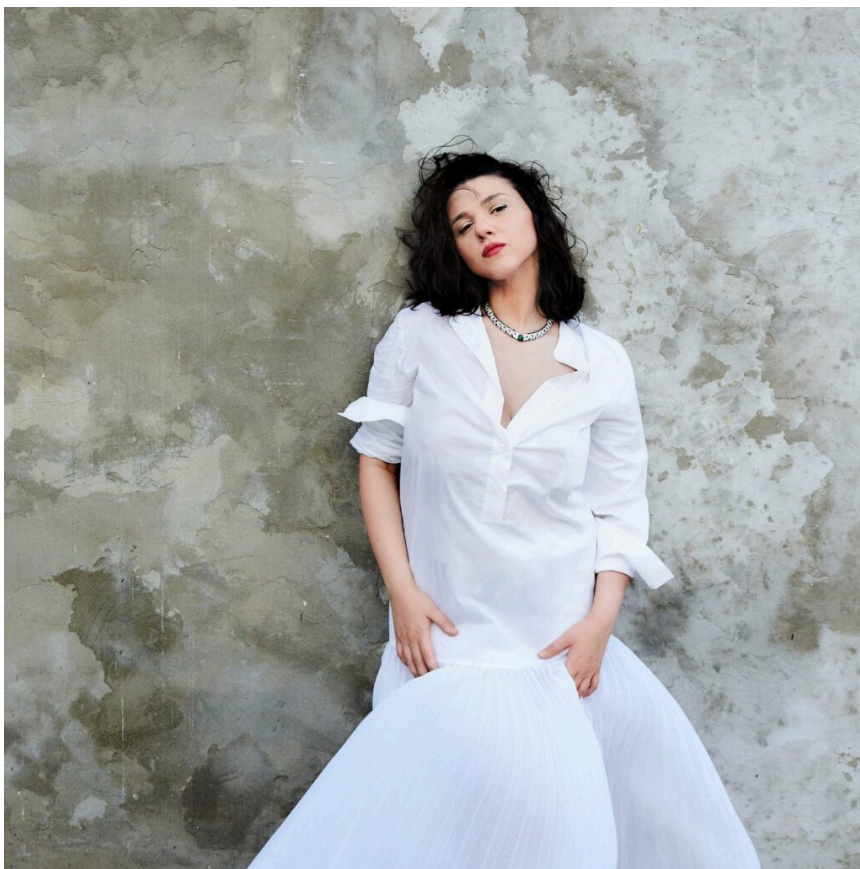
Khatia Buniatishvili.

Mais 2023 sera à coup sûr sublime ! Avec dès l'ouverture, le 2 juillet, une icône, une véritable rock-star du piano, Khatia Buniatishvili qui a donné son 1er concert à l'âge de 6 ans. Elle a remporté le Grand Prix Horowitz à Kiev en 2033 puis le Prix du Public au Concours Arthur Rubinstein en 2008. Depuis, elle parcourt la planète pour une carrière internationale et elle viendra pour la 1ère fois aux Chorégies interpréter l'émouvant Concerto pour piano n° 23 de Mozart.