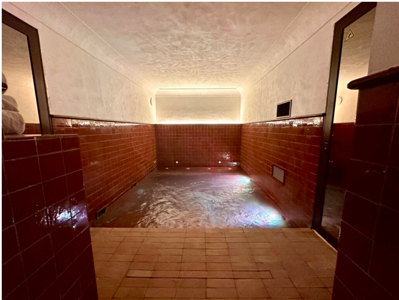
Le Bain romain au spa.