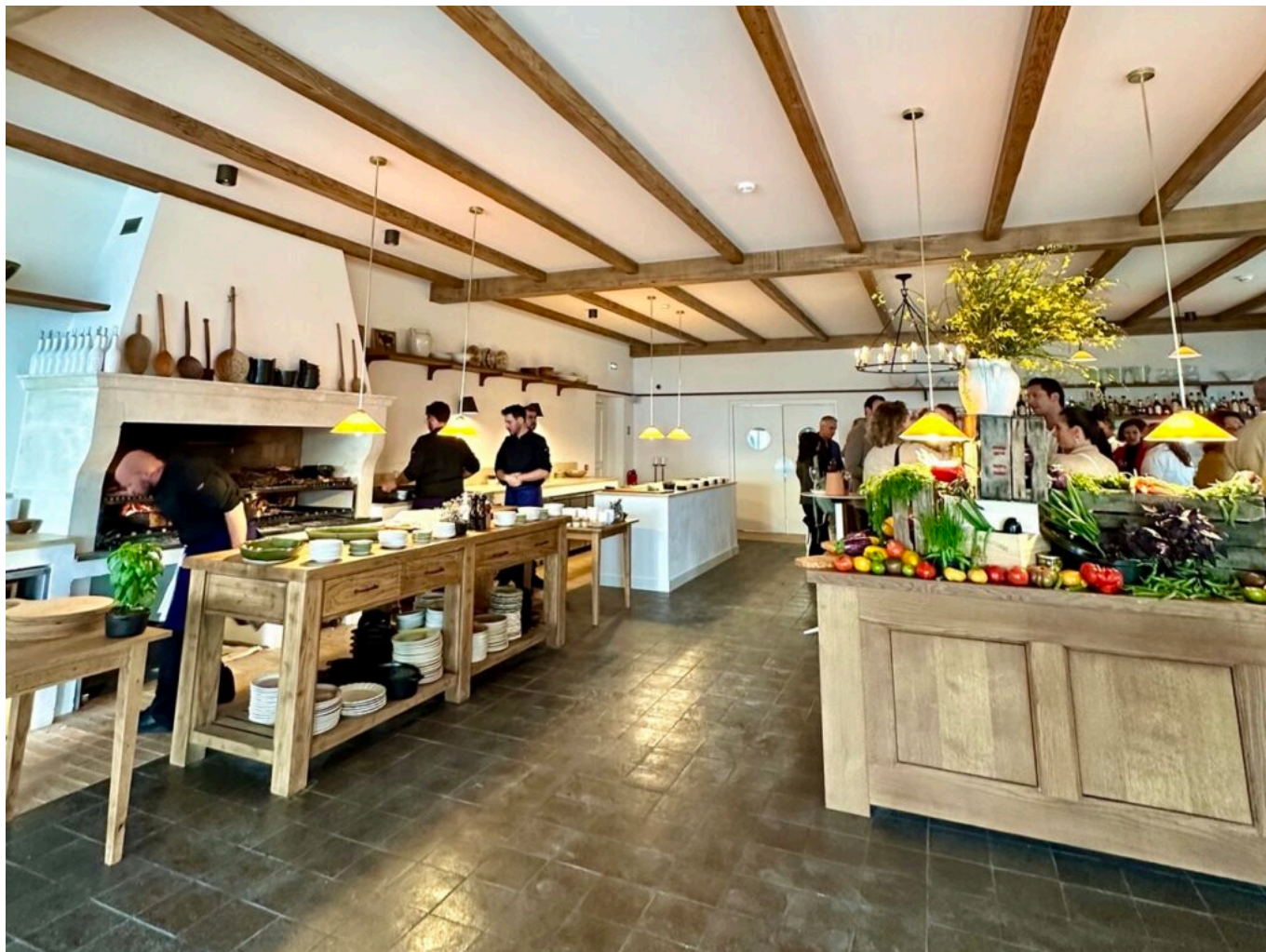
La Bergerie.