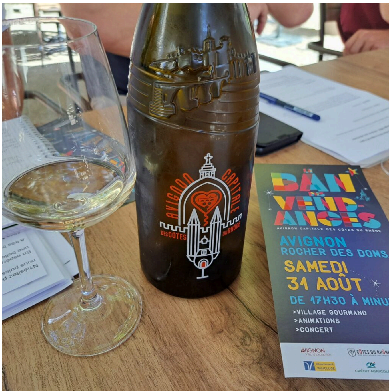
La bouteille 'Avenio'

'Avenio' la bouteille des Côtes du Rhône, vedette du Ban des Vendanges le 31 août