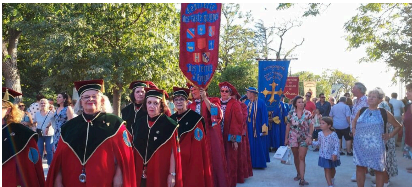
Défilé des confréries bachiques

Pour ce dernier samedi d'août, pour ce moment de convivialité et de partage , dégustation de vins, cela va de soi, mais aussi plateaux de crustacés, d'huîtres, planches de charcuteries et de fromages, glaces en cornets, pâtisseries, bols de soupe au pistou, présence de la Confrérie des Taste-Fougasses d'André Boyer, animations musicales de Rock'n Rhône et bal jusqu'à minuit.