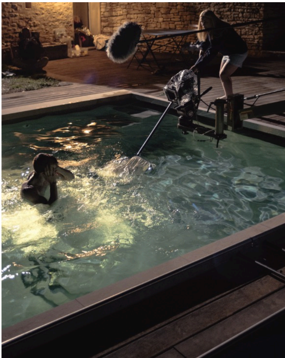
Tournage de Life à Caromb.

Revenons au Vaucluse, c'est la Commission du Film Luberon Vaucluse , basée à Carpentras qui gère les