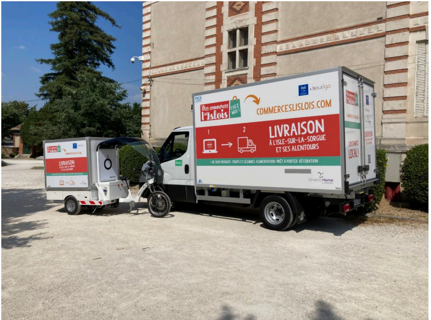
Un camion frigorifique de 12m3 effectuera la livraison à domicile.