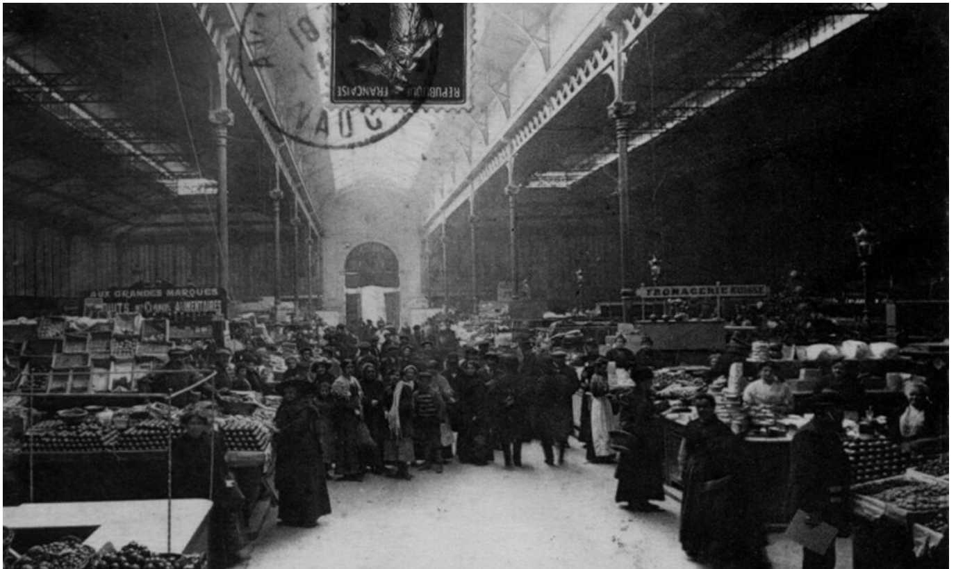
Intérieur des Halles. B.B Imprimerie. 9×14