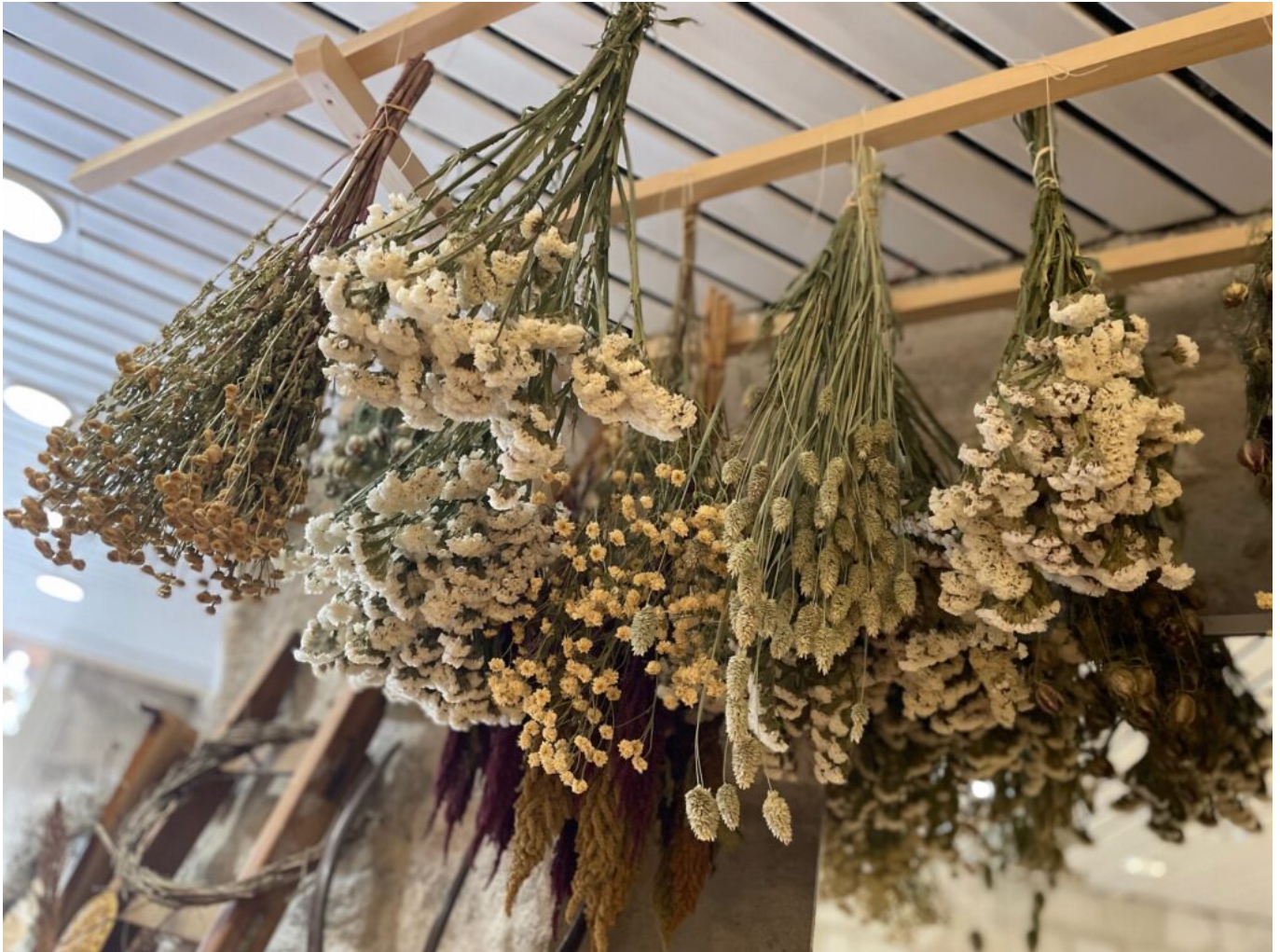
Les fleurs séchées de Lara Hollebecq