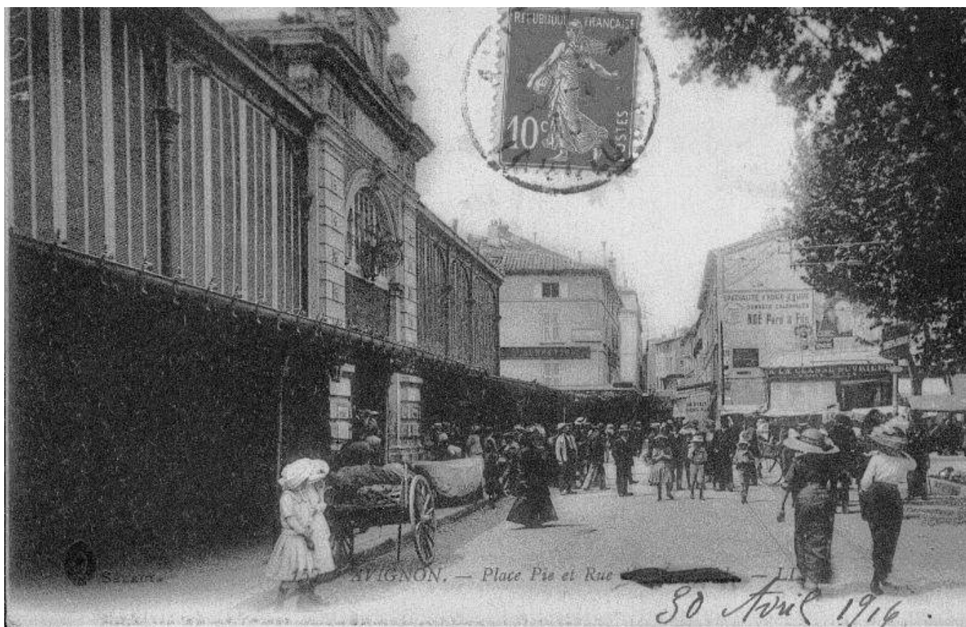
Les Halles en 1914.

Après le marché à ciel ouvert, le long de remparts entre Saint-Lazare et Saint-Michel, Avignon a voulu se doter d'un marché couvert pour accueillir à l'abri du soleil, de la pluie et du mistral les paysans, les bouchers, les poissonniers et les boulangers. Le Président de la République d'alors, Félix Faure avait même déclaré que sa construction serait « d'utilité publique » en 1895. Endommagé par les bombardements de la Seconde Guerre mondiale, il a été remplacé par une halle de fer, façon 'Baltard' qui a été démolie - au grand dam de certains - en 1972 puis rouverte en 1974, avec un parking de 580 places construit au-dessus. Puis en 2006, place à un Mur Végétal de 11m sur 30 qui change de couleurs à chaque saison et qui avait été inauguré par Marie-Josée Roig et le botaniste Patrick Blanc.