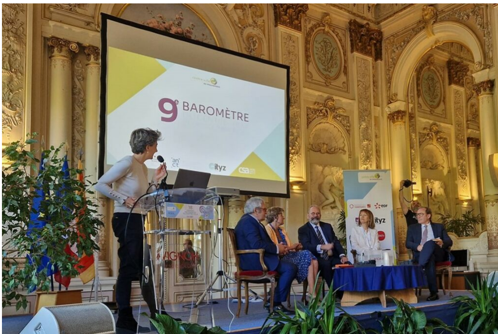
Présentation du 9e baromètre du centre-ville et des commerces à la mairie d'Avignon.

La question environnementale devient aussi un enjeu majeur notamment avec la création d'aménagement ayant pour but de lutter contre les îlots de chaleur.