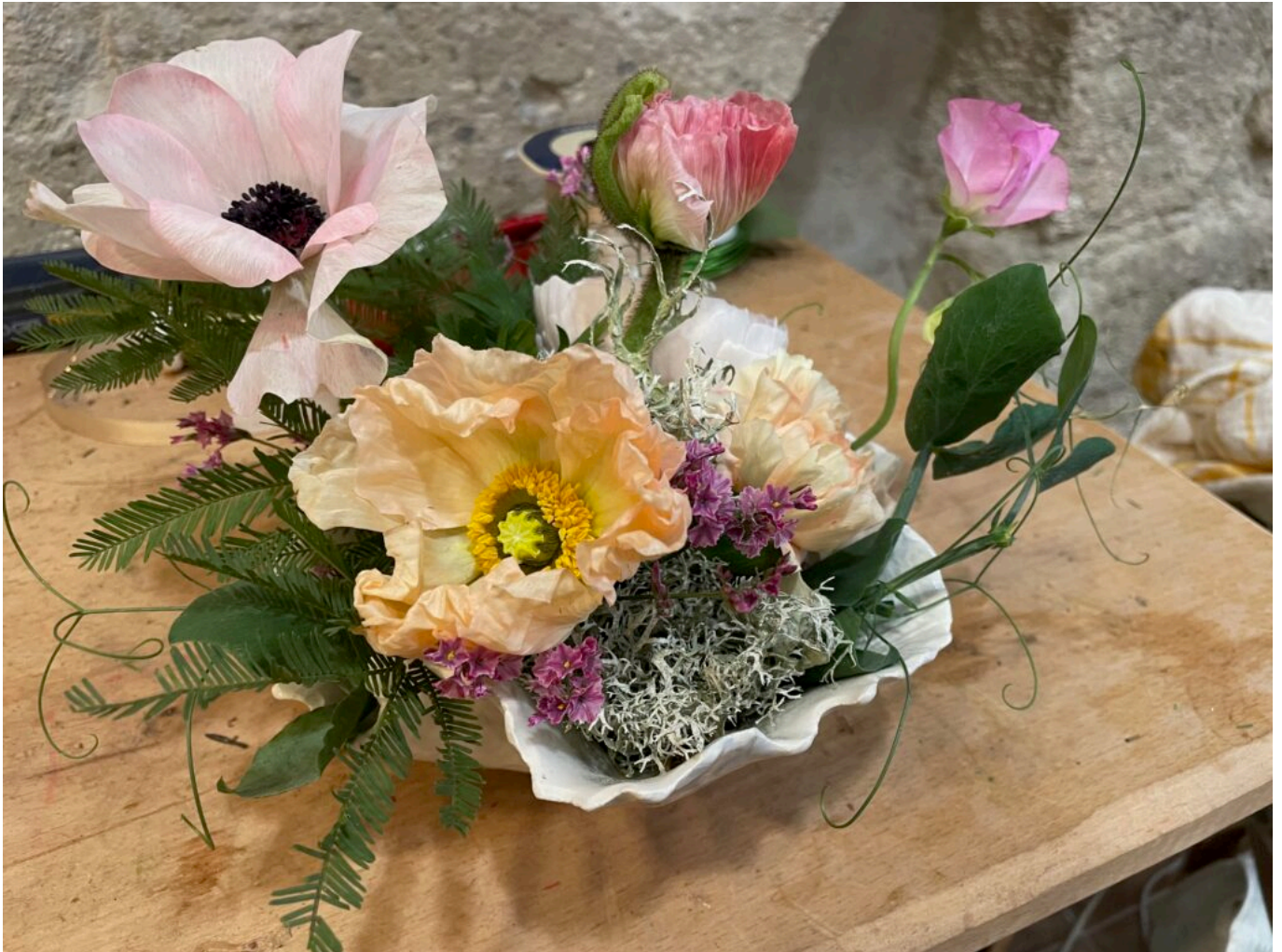
Composition dans une céramique de créateur de Lara Hollebecq