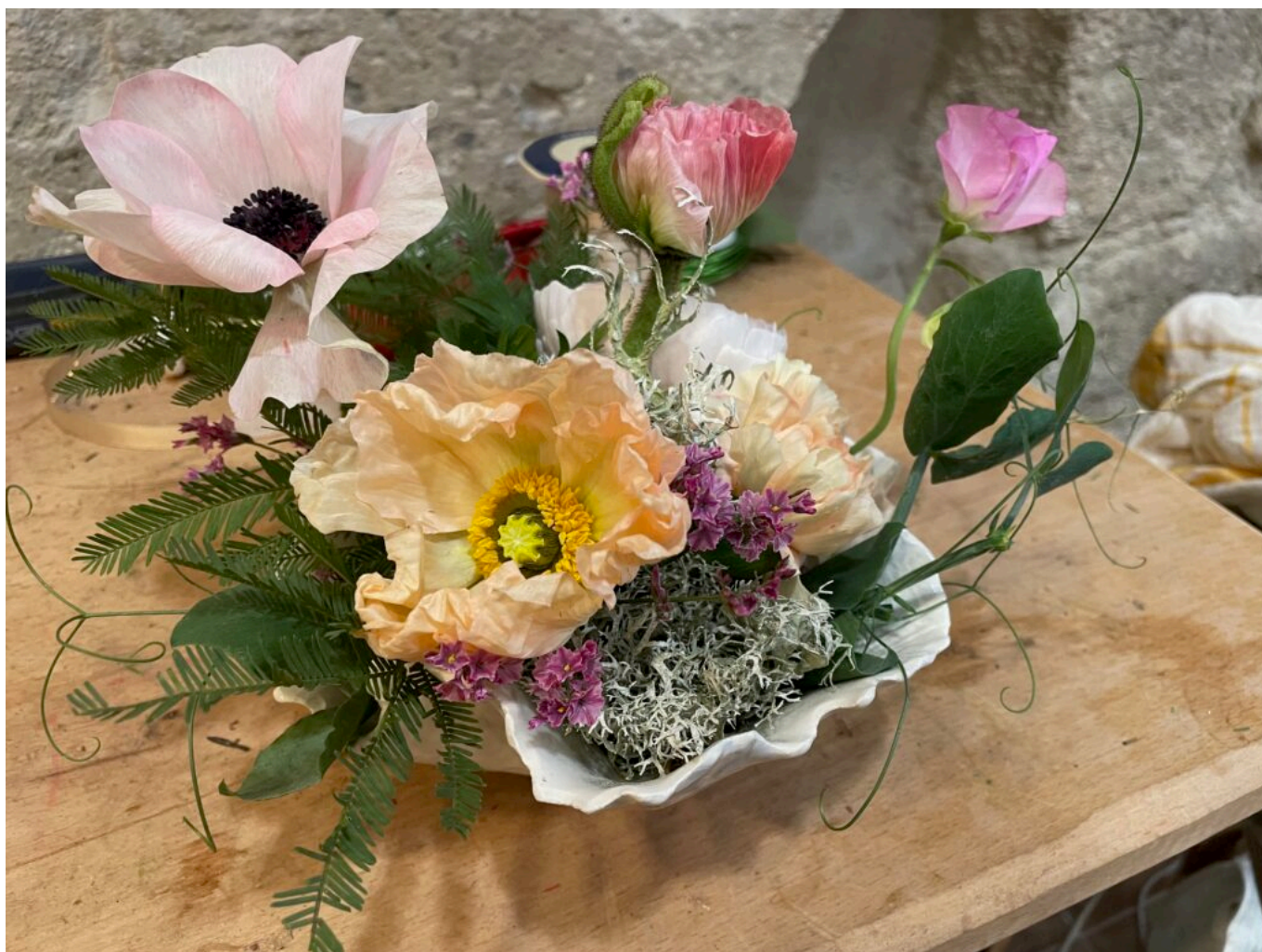
Composition dans une céramique de créateur de Lara Hollebecq