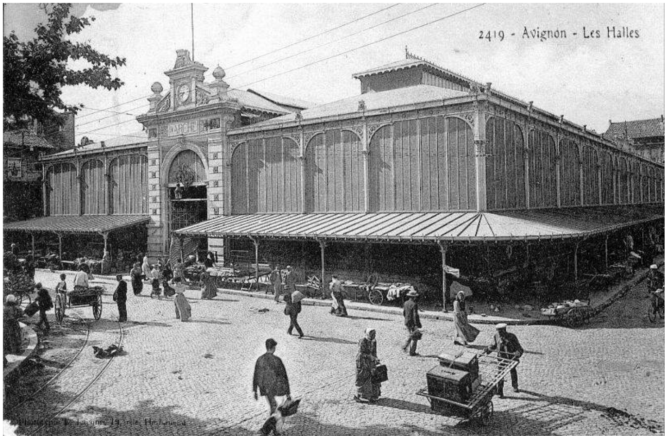
2419 - Avignon - Les Halles