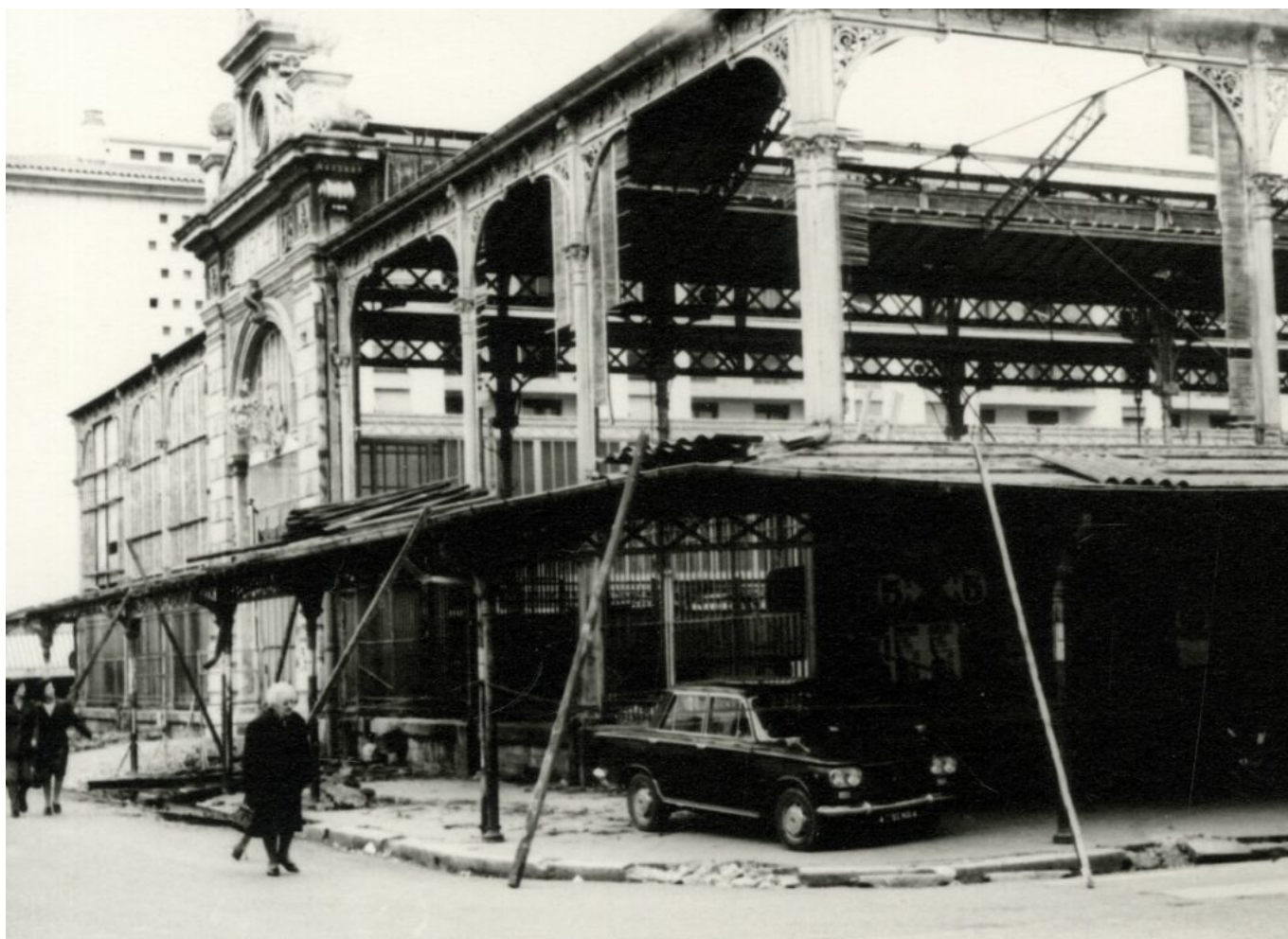
Les Halles en cours de démolition en 1972.