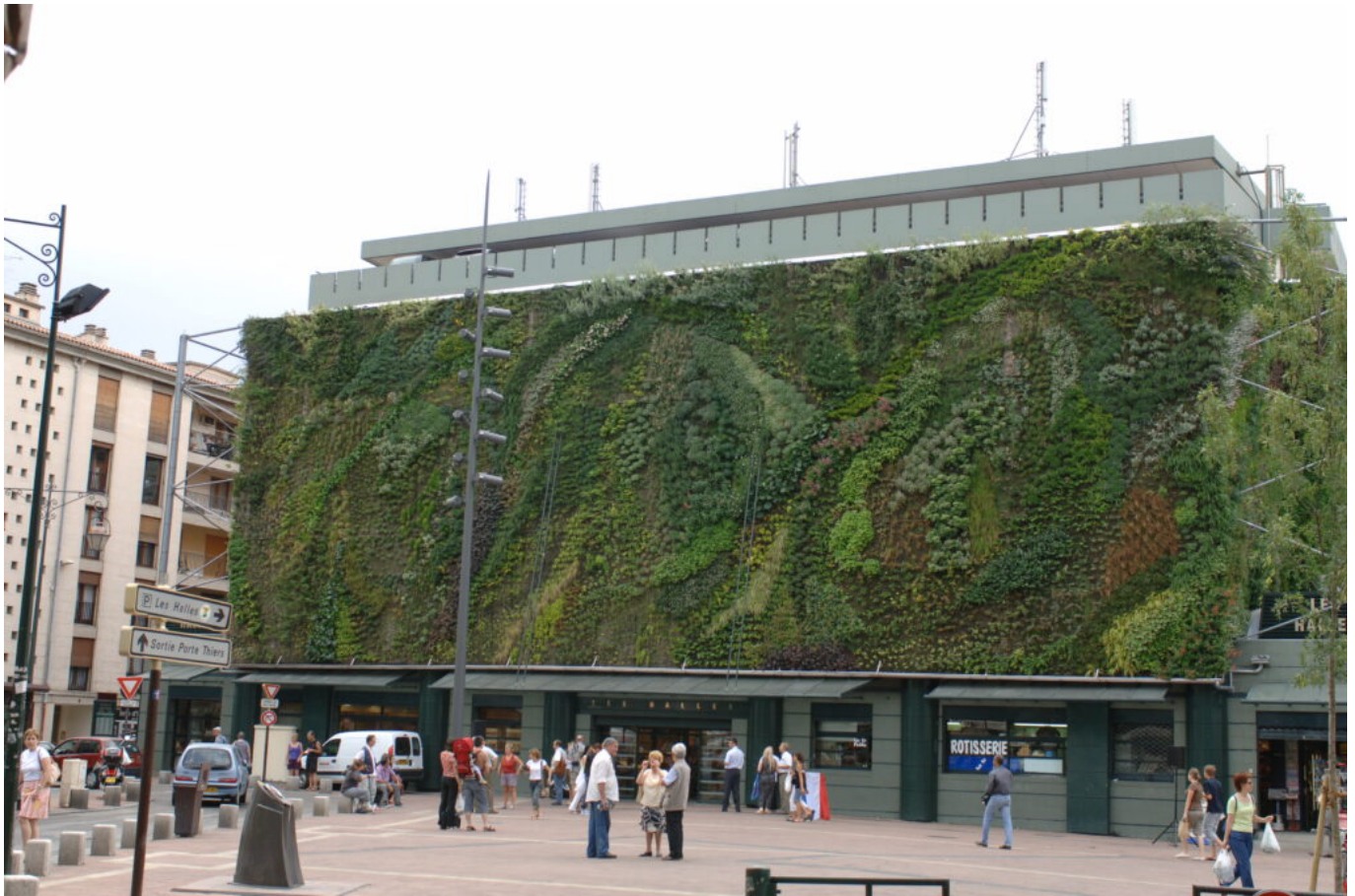
Inauguration du mur végétal des halles le 17 juin 2006.