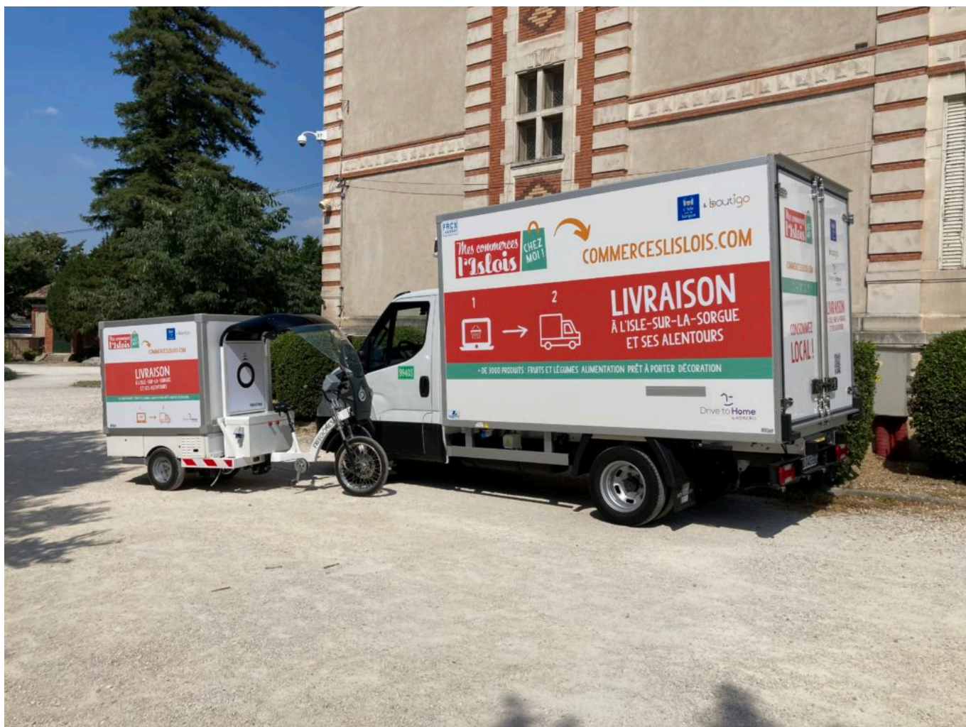
Un camion frigorifique de 12m3 effectuera la livraison à domicile.