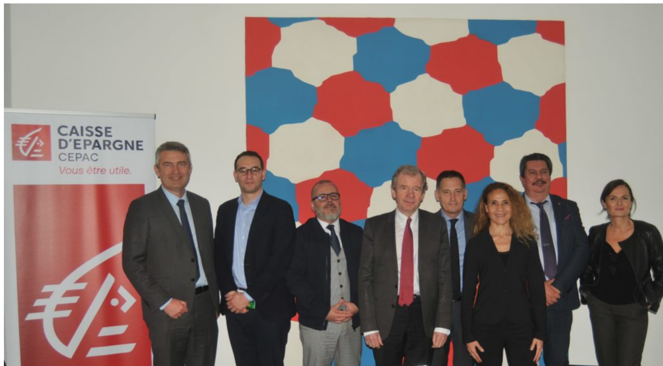
Les représentants de la Cepac et ceux de la Collection Lambert.

Le montant de cette opération de mécénat s'élève à 20 000€ pour une durée de 1 an renouvelable. Il s'ajoute à la dizaine de projets soutenus, chaque année dans le département, par la SLE de la caisse de Vaucluse avec des montants compris entre 3 000 et 15 000€.