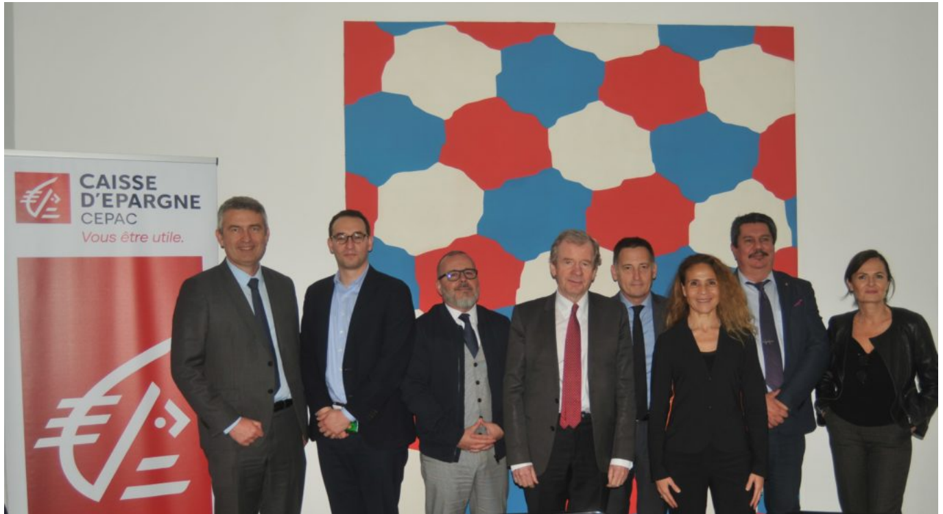
Les représentants de la Cepac et ceux de la Collection Lambert.

Le montant de cette opération de mécénat s'élève à 20 000€ pour une durée de 1 an renouvelable. Il s'ajoute à la dizaine de projets soutenus, chaque année dans le département, par la SLE de la caisse de Vaucluse avec des montants compris entre 3 000 et 15 000€.