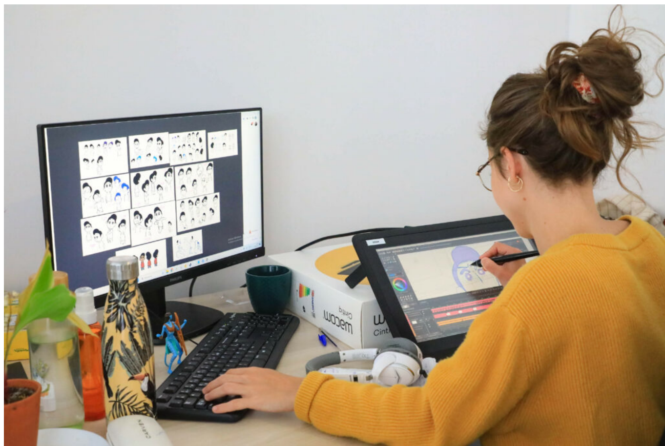
Les artistes réalisent la mise en mouvement des personnages

Avec cette installation, l'objectif des deux créateurs et de leur équipe, composée d'une quinzaine de personnes, est de produire leurs propres films, séries, courts et longs-métrages. Pour l'instant, le studio finalise son premier projet qui consiste à assurer une partie de l'animation du « Collège noir ». Composée de six épisodes de 15 minutes, la diffusion de cette série, adaptée de la BD éponyme d'Ulysse Malassagne, est prévue pour octobre sur la plateforme de streaming ADN , puis sur Slash (France Télévision).