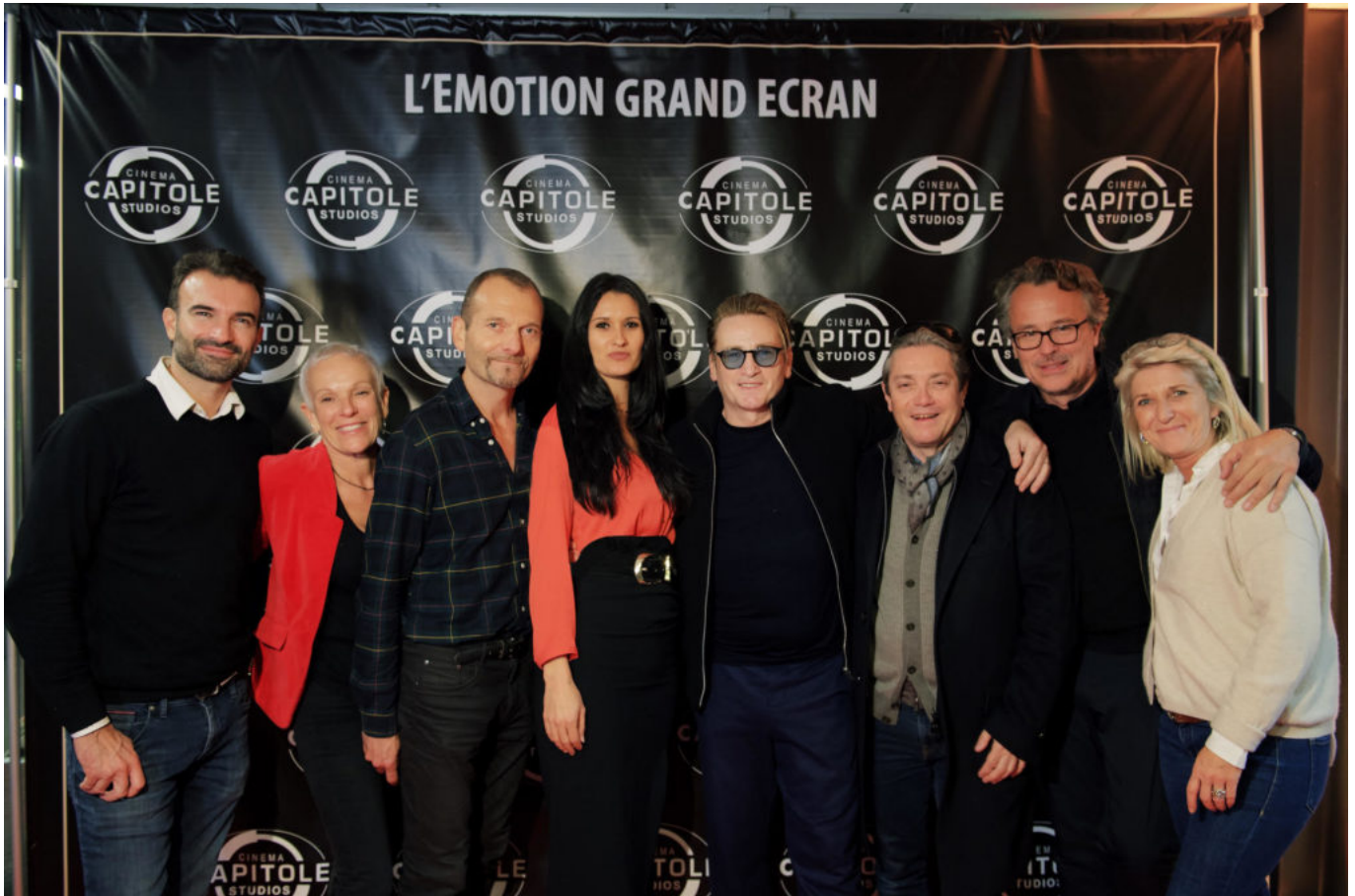
Avant-première au Capitole studios le 12 novembre dernier.

Dans « De son vivant », il n'y a ni mystère, ni miracle. On sait dès le début que le malade n'a que quelques mois à vivre, finalement ce sera un an, quatre saisons ponctuées par la végétation des arbres qui l'entourent et une musique de plus en plus grave, qui passe des cordes au saxophone ou à l'harmonica. Et le déroulé du scénario s'articule autour d'une palette de sentiments, de nuances parfaitement suggérées par le jeu de Benoît Magimel. Du déni de la maladie à l'acceptation, la résignation, en passant par la sidération, la dépression, la colère et la révolte. Le comédien qui puise en lui des ressources intenses de sensibilité, d'intuition pour évoluer avec la maladie. « J'ai voulu gérer ma transformation physique, ma fragilité grandissante, mais il ne s'agissait ni de déchéance, ni de décrépitude. J'ai dû perdre des kilos, mais comme le Covid a coupé le tournage en deux temps, j'avais repris du poids entre-temps. Pour avoir des joues plus creuses, j'ai demandé à mon dentiste de dévisser des pivots, ma voix, son débit, son timbre aussi ont changé, j'avais la trouille. Je suis un homme différent aujourd'hui ».