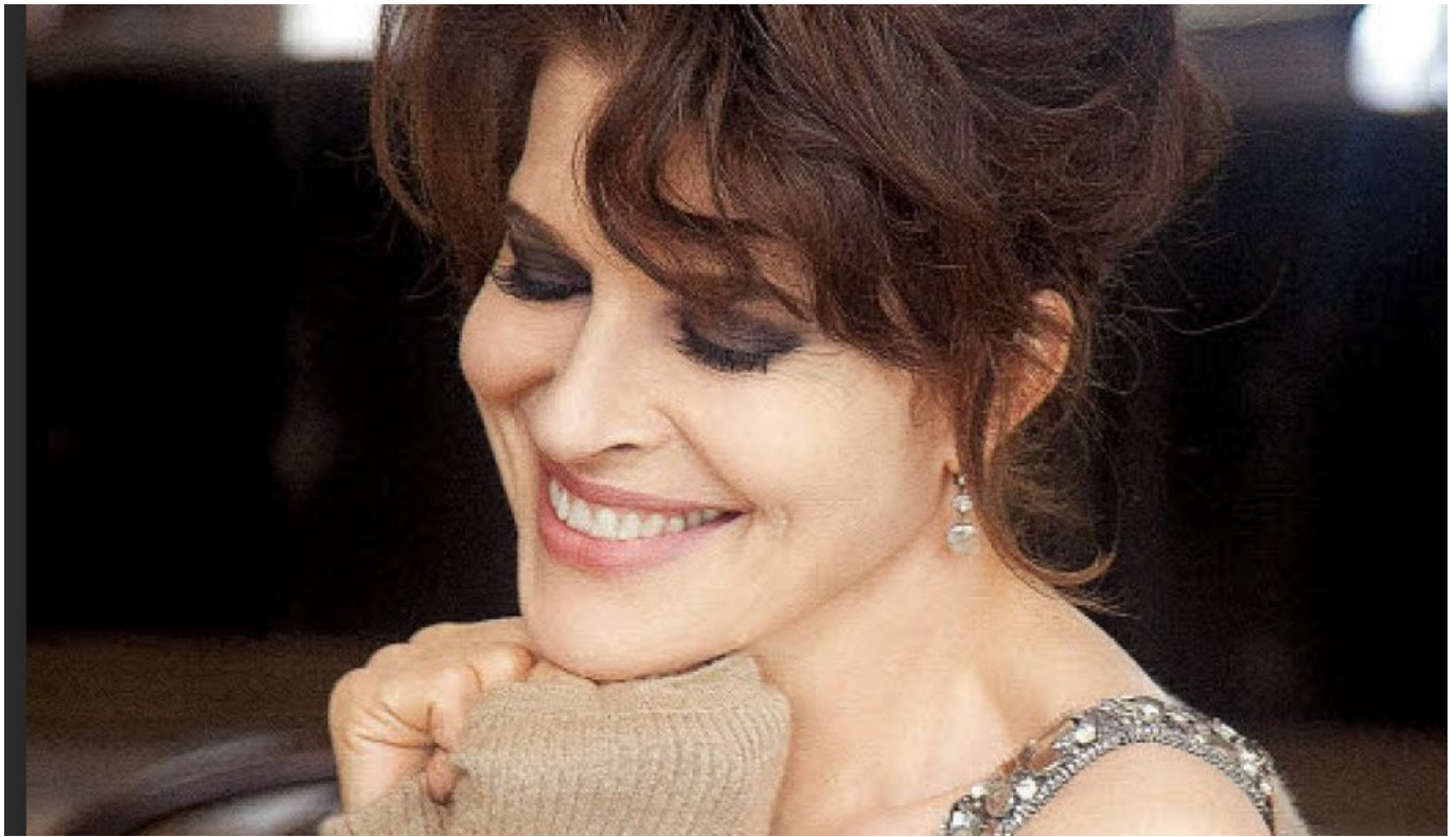
Fanny Ardant