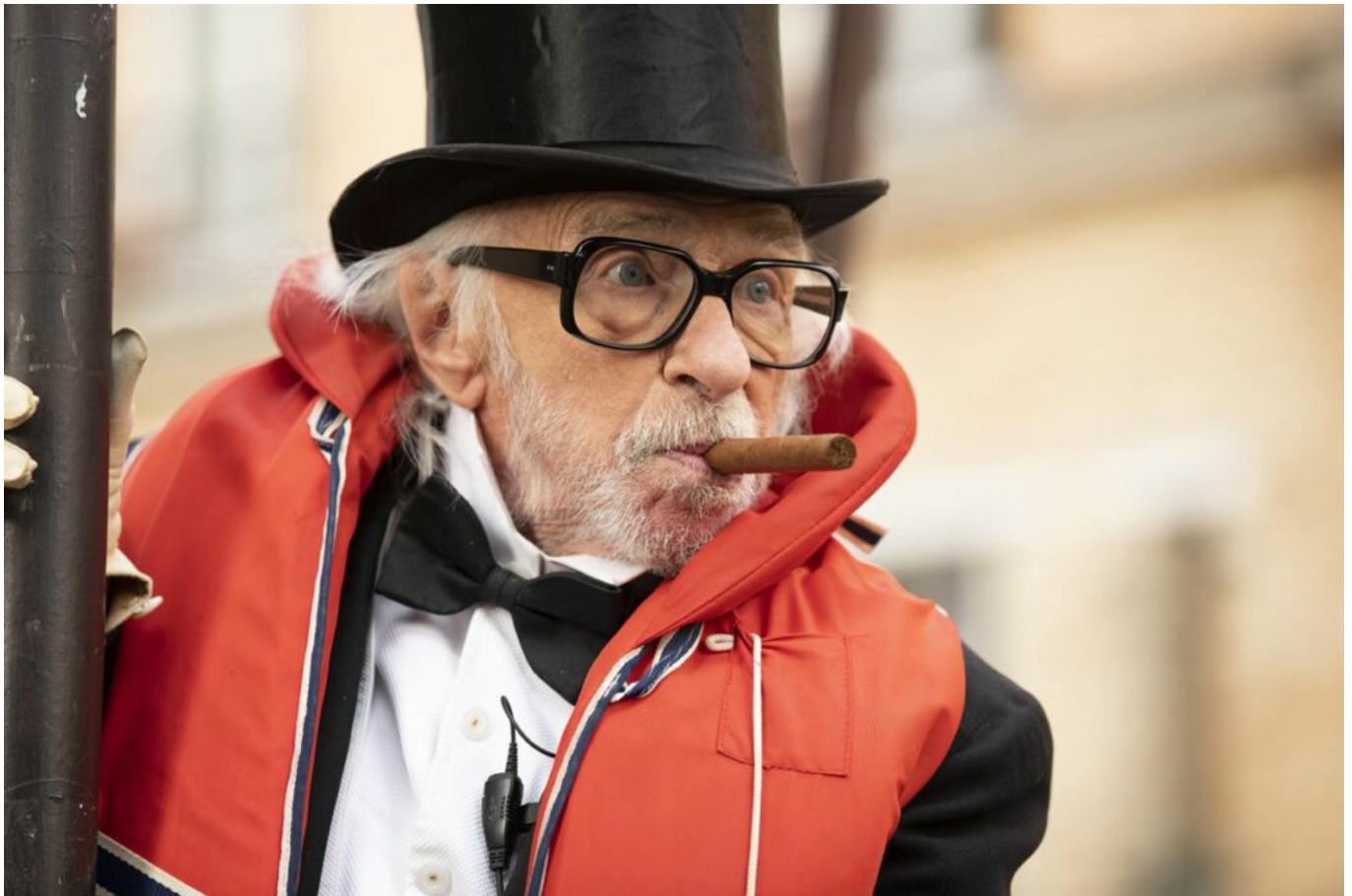
Pierre Richard, Les vieux fourneaux