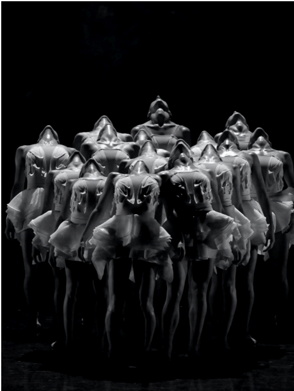
Le Lac des Cygnes.