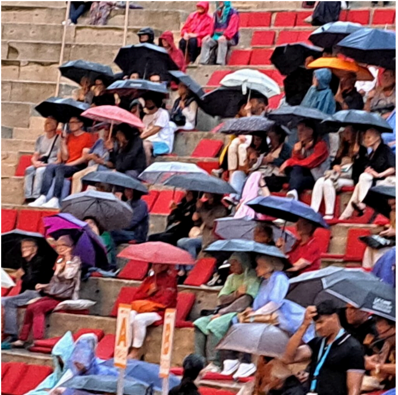
Forêt de parapluies sur les gradins