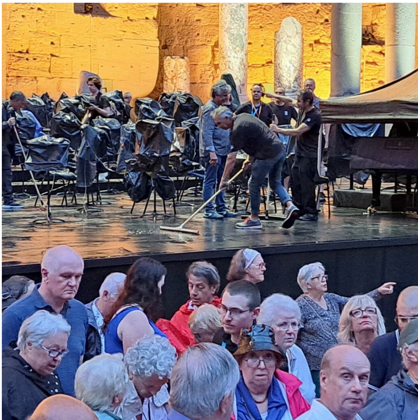
Corps de... « balais »...sur scène