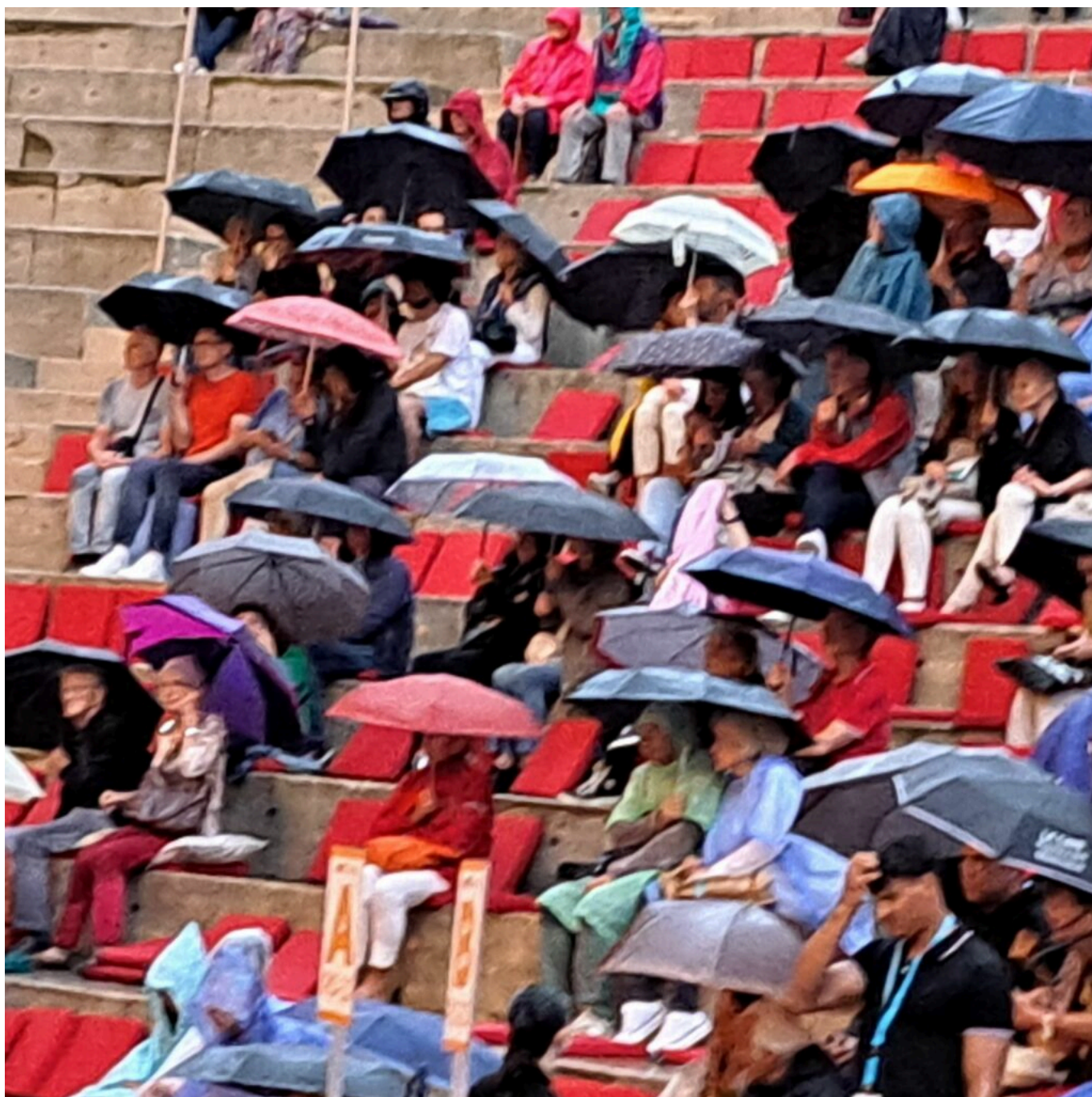
Forêt de parapluies sur les gradins