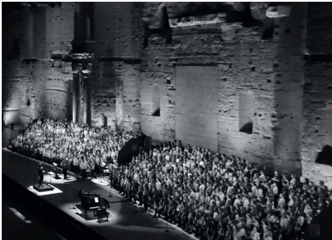
Pop the Opera.