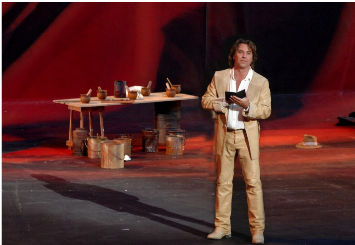
Roberto Alagna dans Tosca.

Que de tenors et baryton ont mis le feu aux gradins : Luciano Pavarotti, Plácido Domingo, José Carreras, Leo Nucci, José Van Dam, Ruggero Raimondi, Roberto Alagna, Rolando Villazón, Alain Fondary, Gabriel Bacquier, Vittorio Grigolo, Juan-Diego Flores, Giacomo Aragall, Jonas Kaufmann.