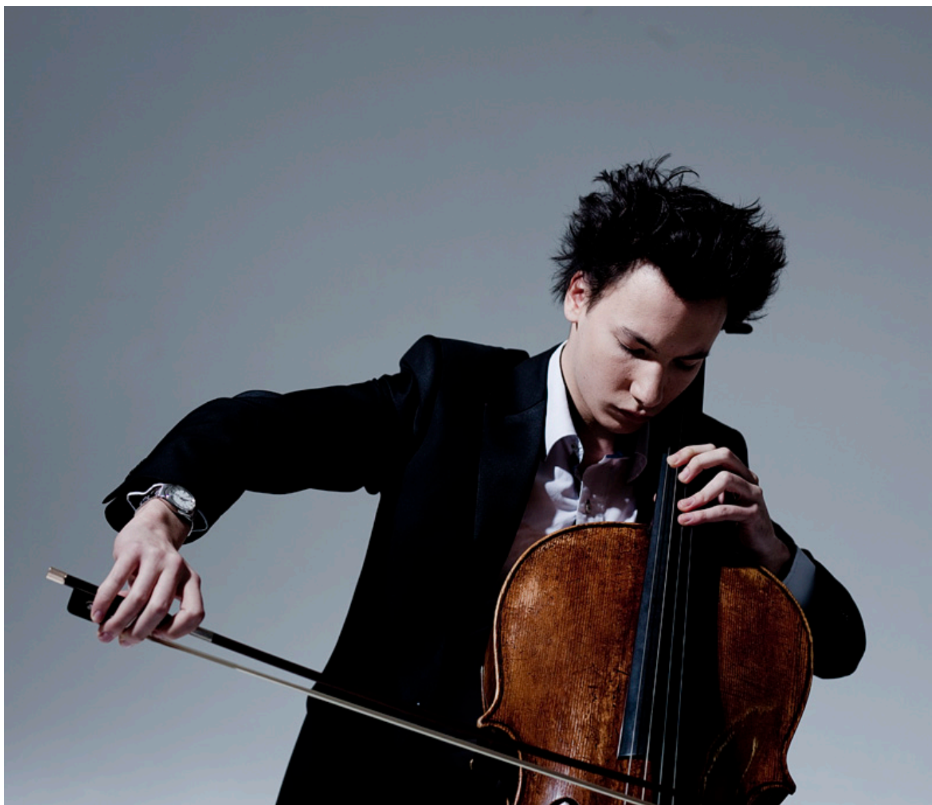
Edgar Moreau