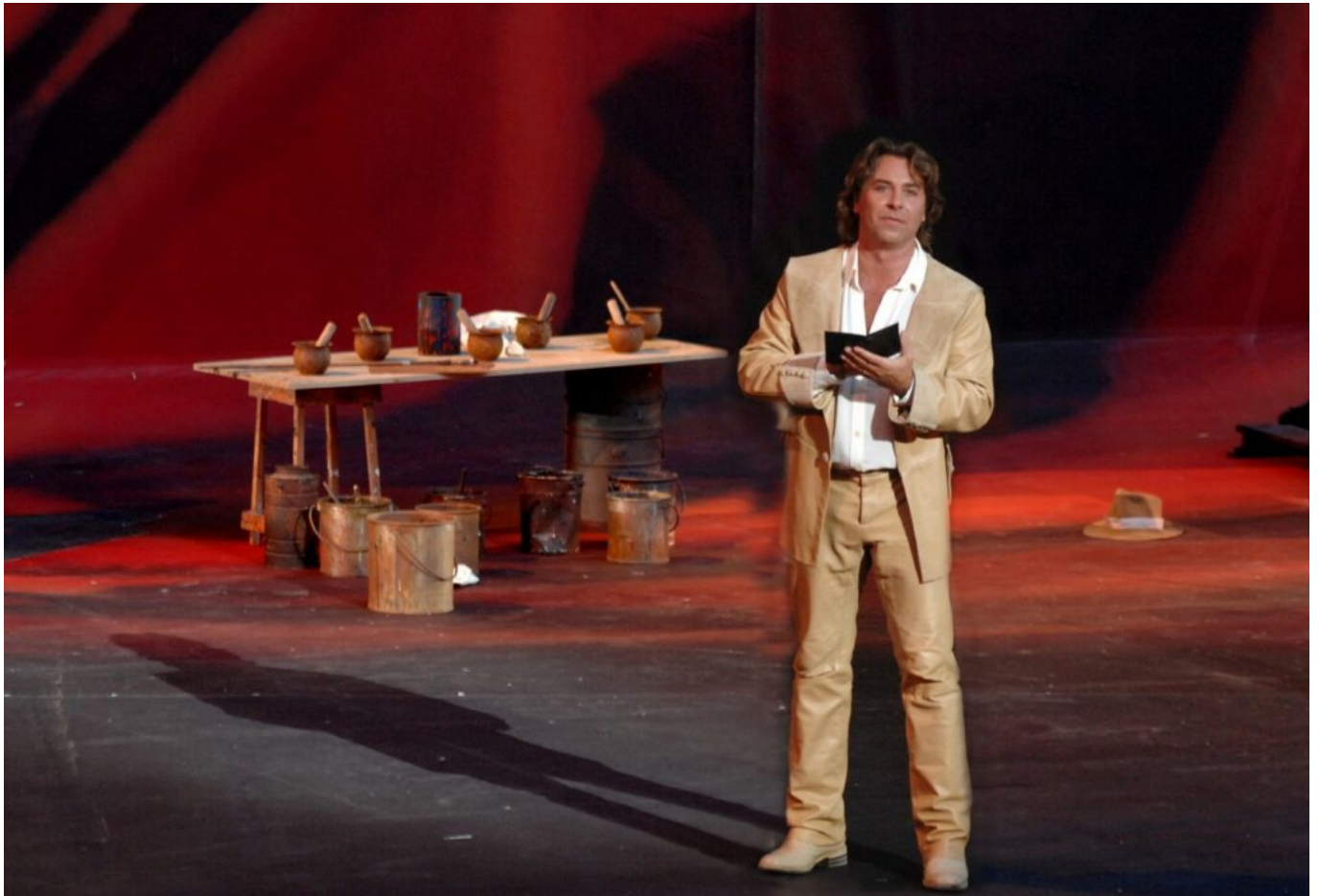
Roberto Alagna dans Tosca.

Que de tenors et baryton ont mis le feu aux gradins : Luciano Pavarotti, Plácido Domingo, José Carreras, Leo Nucci, José Van Dam, Ruggero Raimondi, Roberto Alagna, Rolando Villazón, Alain Fondary, Gabriel Bacquier, Vittorio Grigolo, Juan-Diego Flores, Giacomo Aragall, Jonas Kaufmann.