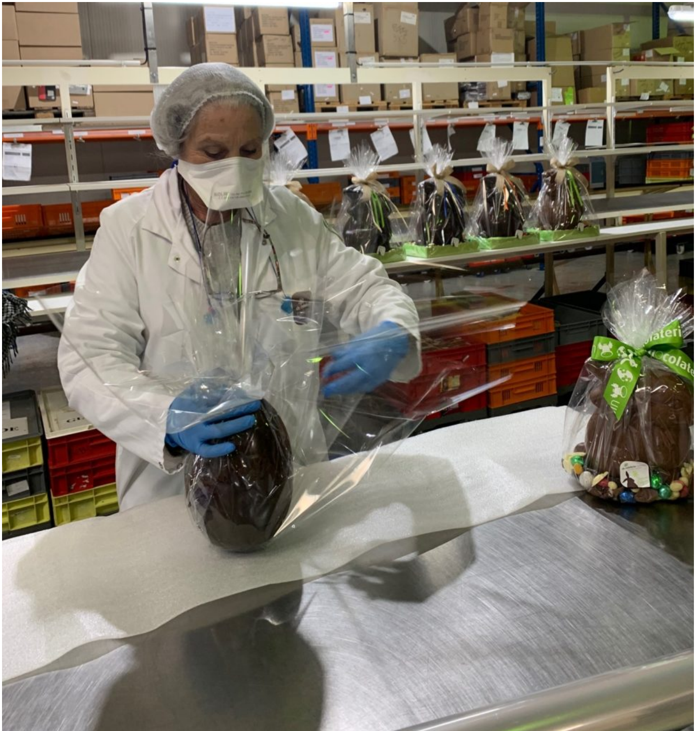
Conditionnement des commandes