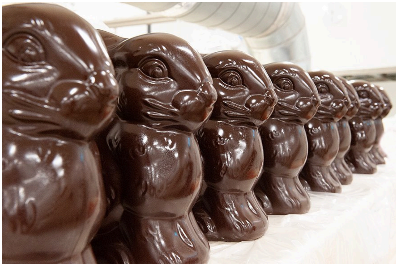
lapins en chocolat