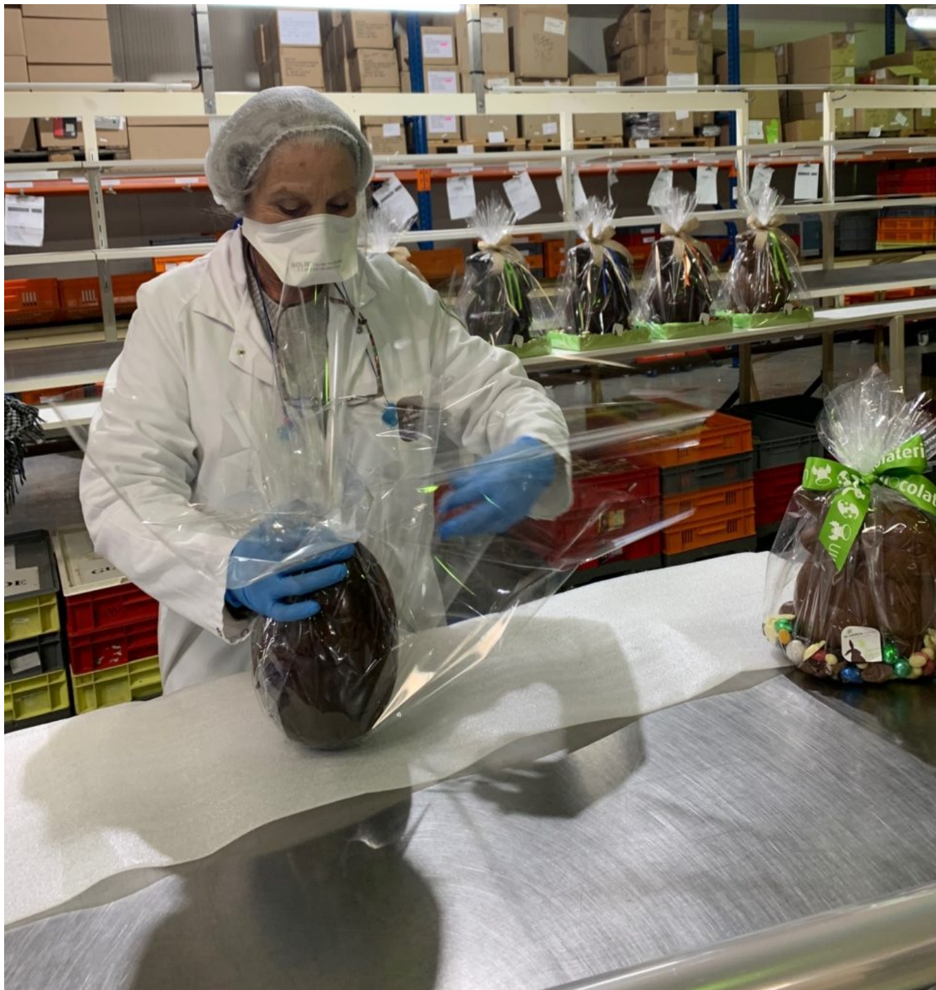
Conditionnement des commandes