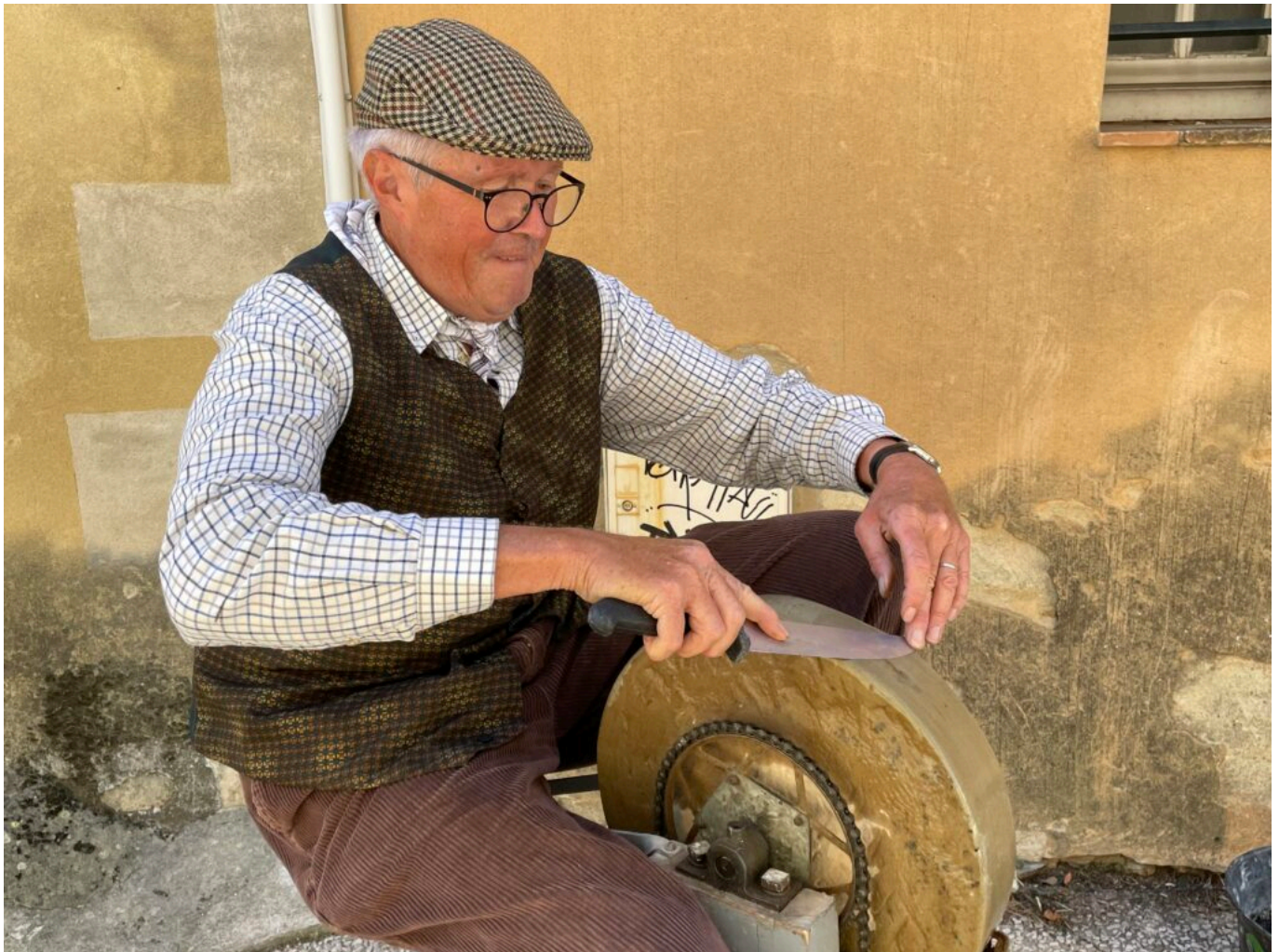
Le Rémouleur