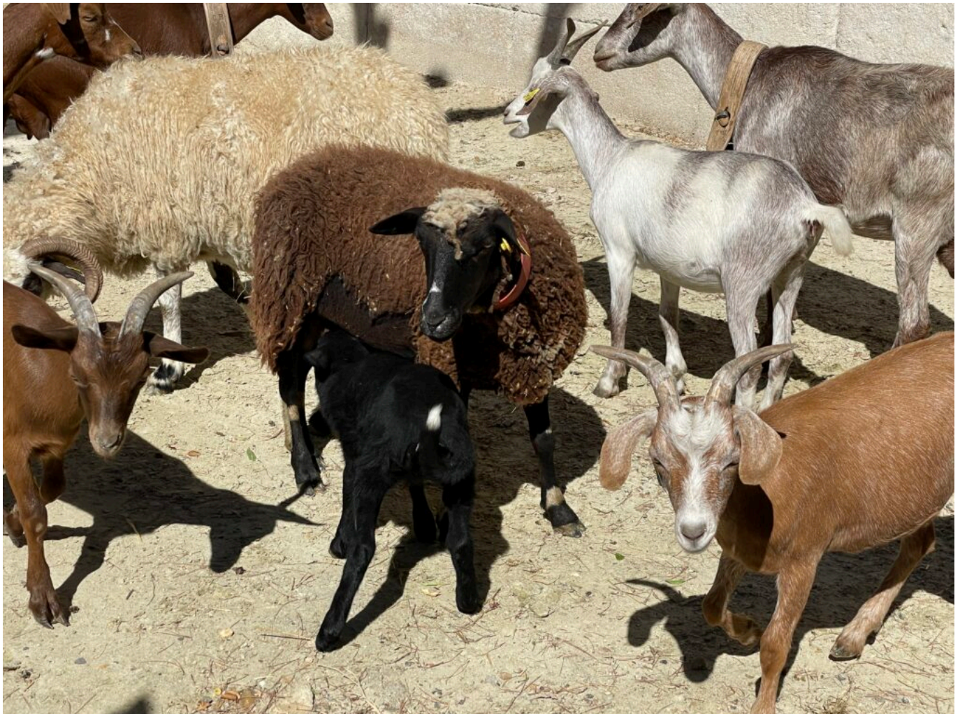
Troupeau d'ovins

Les visiteurs seront invités à entrer dans l'église et à faire le parcours des croix, à l'église Notre Dame de l'Assomption, hors offices et cérémonies. Les bergers avec leurs moutons, âne, chèvres et chien chemineront dans les rues et les calades. Il sera tout aussi possible de profiter de ces dernières belles journées de l'été pour découvrir les sentiers des plantes, des peintres et le patrimoine bâti.