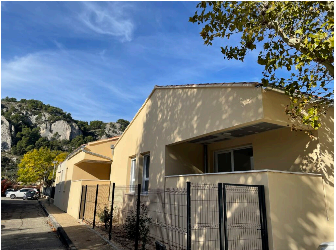
Le Petit Luberon à Cavailon, résidence Seniors pour personnes autonomes

novembre 2021 et la résidence Auréus qui proposera 38 logements collectifs pour la location pour un peu plus de 4,7M€ ; La résidence Le Lys au Thor qui propose 24 logements collectifs et 6 logements individuels pour près de 7,7M€ ; et, enfin, la Résidence Le Bleu du Ciel à Caumont-sur-Durance constituée de 36 logements, dont 9 proposés à la location pour un peu plus de 1,2M€.