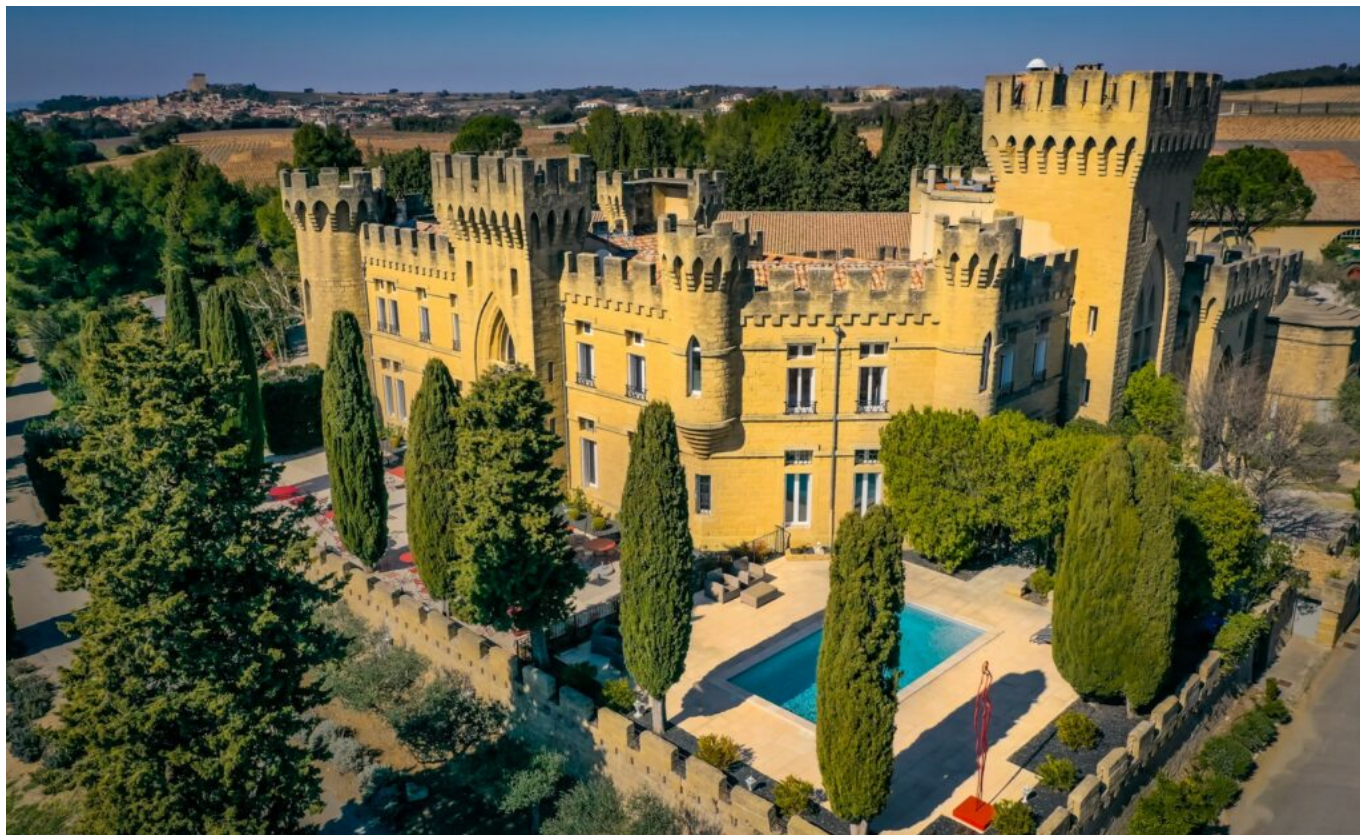
Le Château des Fines Roches