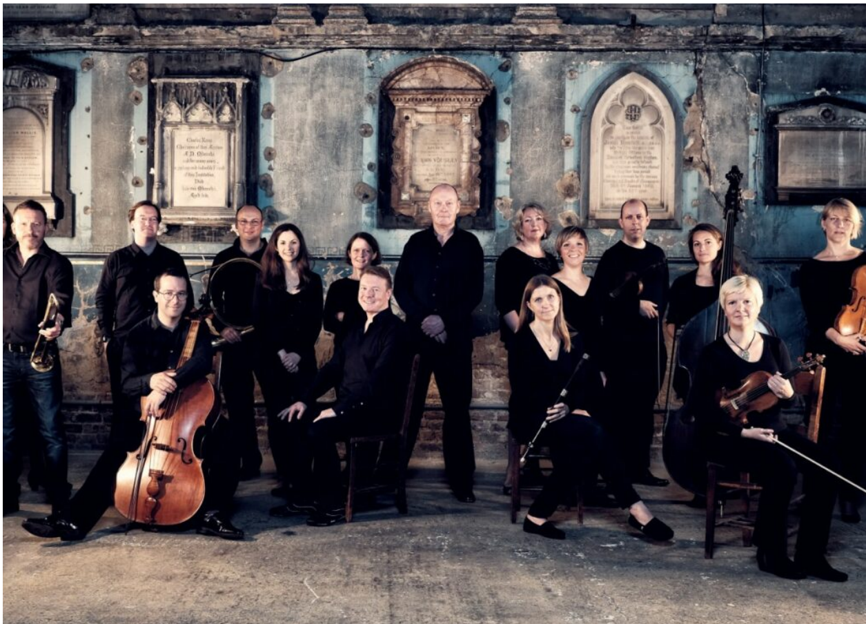
«King Arthur» par le Gabrieli Consort le 09 juillet place de l'Horloge à Ménéribes