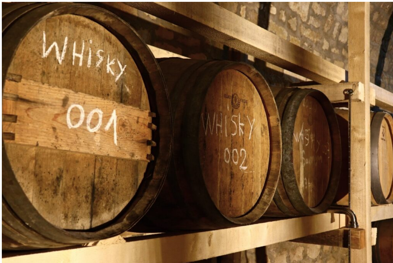
Les barriques dans lesquelles vieillissent les whiskys.