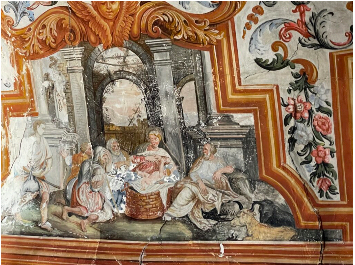
Détail d'une fresque de la chapelle Notre dame la Brune