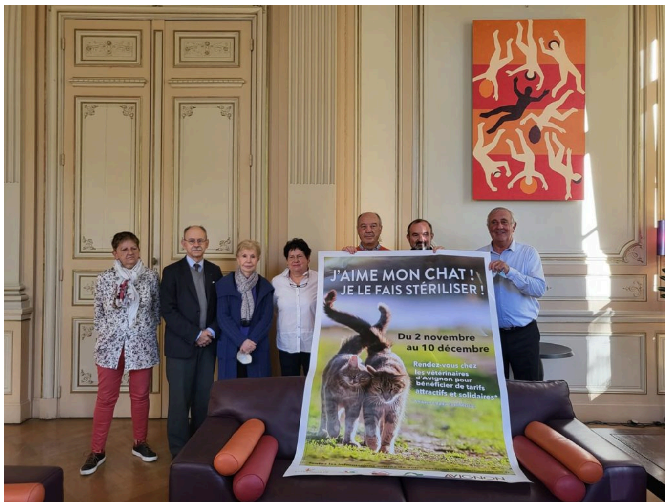
Annnonce de la campagne de stérilisation.