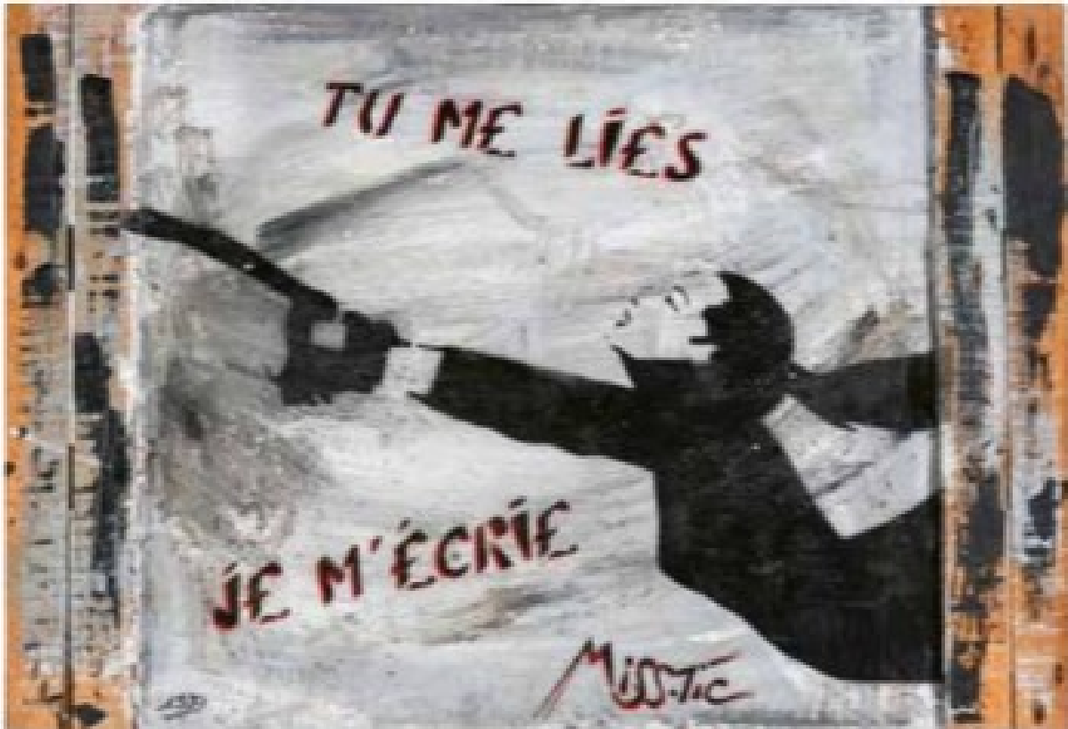
MISSTIC (1956-2022) : Tu me lis, je m'écris. Pochoir sur toile et bois. Signé en bas et daté 1990. Dimensions: 72x103 cm. 2 000/3 000 €

Nous avons aussi repéré cet important bureau en placage de noyer à caisson central suspendu également doté de deux grand tiroirs, le tout en piètement de fonte d'aluminium. Le plateau est ouvrant en son centre, découvrant le caisson dossiers. Il s'agit d'une édition ancienne. Ce mobilier est signé George Nelson (1908-1986) designer et Herman Miller fabricant mobilier international éditeur 64906. Ce bureau pourrait être accompagné du fauteuil à haut dossier pivotant sur roulettes avec sa paire de chaises pivotantes signées Charles et Ray Eames, éditions anciennes le tout à partir de 1 500€.