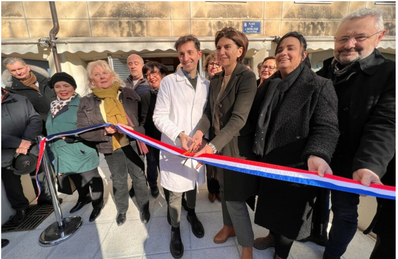
Inauguration de la maison de santé à Avignon en février dernier.

« Les Vauclusiens ont envie de vieillir chez eux. »